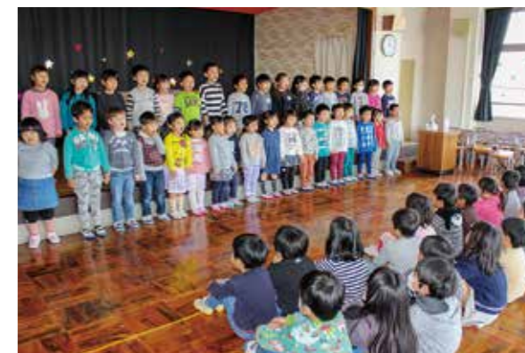
←お別れ会で歌を披露する子どもたち♪

3月でお別れの年長さんとお別れ会をしました。一緒に歌ったり、おやつを作って食べたり、楽しい時間はあっという間…年少・年中さんの「ありがとうの花」の歌には、胸が熱くなりました。最後にプレゼントをもらって、最高の笑顔の年長さんでした。離れてもずっとともだちですね♪