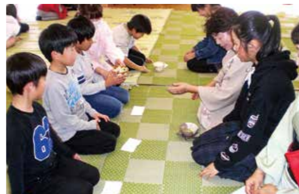
←礼儀などを学び子どもたち☆

2月25日、お茶の先生を招き、お茶の飲み方などの作法を学びました。「このお菓子食べてもいい〜?」「にがーい!!」と時折子どもたちらしい声も聞かれましたが、美味しく抹茶と饅頭をいただきました♪また、高学年はお茶をたてることにも挑戦!!不慣れながら作法を守り、お茶を丁寧にたてる姿が見られました。日本の文化や礼儀などを学び、素敵な時間を過ごすことができました。