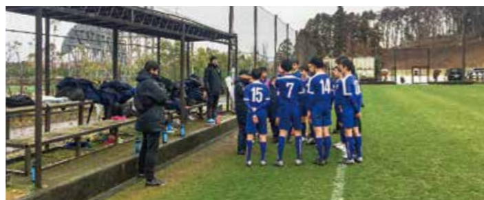
←さらなる高みを目指す選手たち