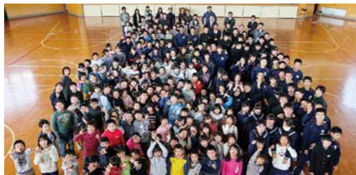
←小・中学校の子どもたち全員での記念撮影

平成26年8月から広野小学校の校舎で小学生と一緒に過ごしてきましたが、新年度から元の校舎で学校が再開するにあたり「広野小学校に感謝する会」を3月1日に行いました。また、4月からはスクールバスがなくなるため、これまでお世話になったバスの運転手さんに感謝する会も小中合同で行いました。