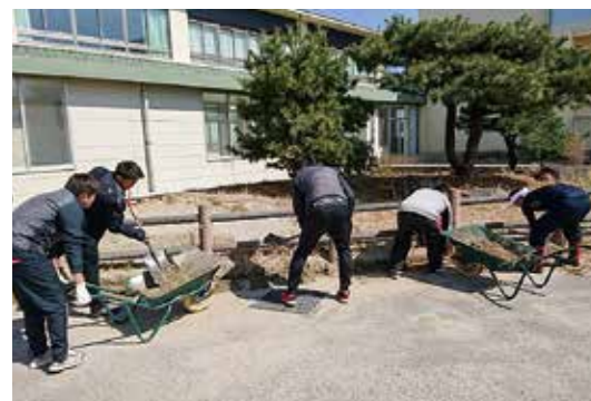
↑感謝を込めて大掃除