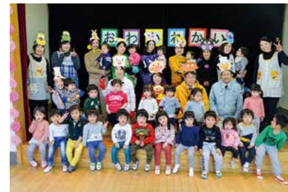
←4月からは「ひろぼーく」で過ごす子どもたち

こども園移設のため、今回は全員が修了児となり、保育所とのお別れ会を行いました。みんなでお遊戯をしたり、先生たちの出し物を見たりしました。プレゼントを貰ってお弁当パーティーをして、とてもご機嫌な子どもたちでした♪4月からは広野こども園ひろぼーくで元気に過ごしていきたいです。