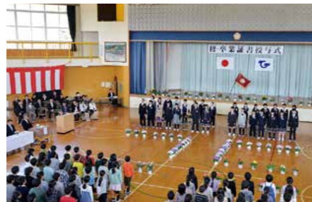
←卒業証書授与式の様子

3月22日、平成30年度修・卒業証書授与式を行いました。卒業生30人が清々しい姿で巣立っていきました。夢と希望を持って、楽しい中学校生活を送ってほしいと思います。本年度は、206日間の学校生活がありました。保護者の皆さまはじめ、地域の皆さま、多くの皆さまに支えられ今日の日を迎えることができました。ご支援とご協力に感謝申し上げます。