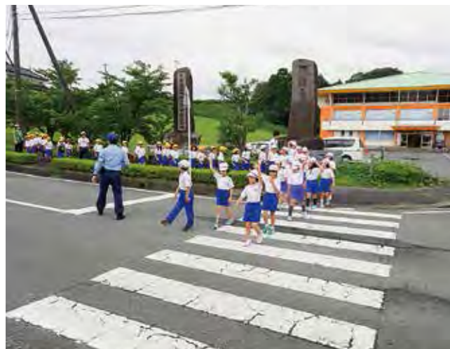
↑横断歩道の渡り方を学ぶ児童

9月4日、低・中・高学年に分かれて交通教室を行いました。1・2年生は、歩道の歩き方や横断歩道の渡り方などを、実際に路上に出て学習しました。ご指導いただいた双葉警察署の方からは、「自分の目で確かめることが大切」ということを教わりました。3年から6年生までは、自転車の安全な乗り方について学習しました。自転車をうまく操作することが難しかったようです。交通事故にあわないよう当日の下校時から取り組むことを約束しました。