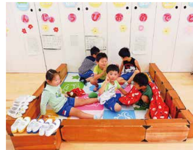
↑ごっこあそびを楽しむ5歳児です