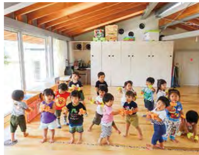
↑一緒にお遊戯をする1、2歳児です