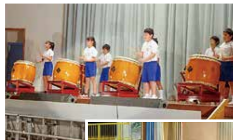
←迫力ある太鼓演奏をする和太鼓クラブ