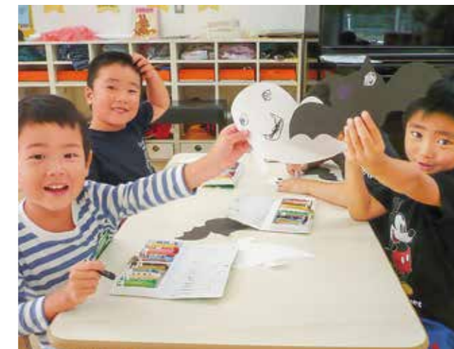
↑制作の様子(4歳児)です

4歳児ひまわり組さん。ハロウィン制作の様子です。お喋りを楽しみながら、おばけやこもりに自由に顔を描きました。