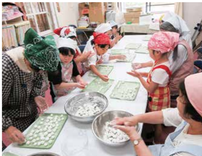
↑おだんご作りに参加する1年生♪

9月20日に、老人クラブのおじいちゃん、おばあちゃんと一緒に、おだんご作りを行いました。作り方を聞いて、おだんごを楽しそうに丸める子どもたち☆