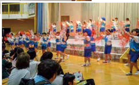
→元気いっぱいダンスを披露する2・3年生

10月5日、秋晴れのもと、令和元年度の学習発表会を実施しました。朝早くから、来賓・保護者の皆様にはご来場いただきありがとうございました。子どもたちはこの日のために、これまでの学習の成果と自分達の思いを伝えようと練習に励んできました。それを、どの子どもも精一杯発表することができました。温かいご声援に感謝申し上げます。