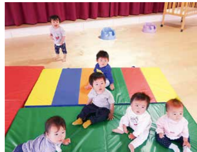
↑マットの上で楽しむ0歳児です