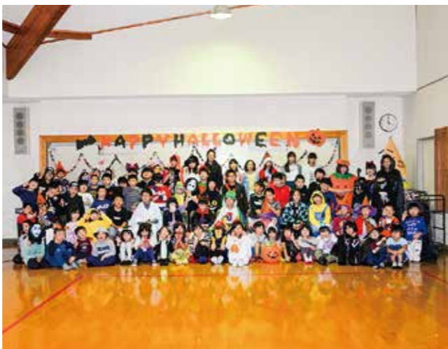
↑お菓子をくれなきゃいたずらするぞ☆

『どんな仮装をしようかな?』と楽しみにしていたハロウィン。10月30日にみんなでハロウィン☆パーティーを行いました!こわ〜いお化けやとんがり帽子を被った魔法使い、可愛い妖精…思いおもいの仮装をした子どもたち。『トリック☆オア☆トリート』とたくさんのお菓子をもらい、笑顔のたえない楽しい時間を過ごすことができました!!