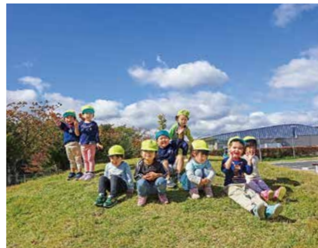
↑築山で楽しむ2歳児ばら組さんです

11月秋晴れの下、こども園駐車場前にある築山にて元気っぱい遊ぶ2歳児ばら組さん。築山の登り下りを楽しみ「ヤッホー」と友だちと声をかけ合ったり、高い所からの風景を満喫しました。また、赤や黄色に色づいた落ち葉も子どもたちの大切な遊び道具の一つとなりました。