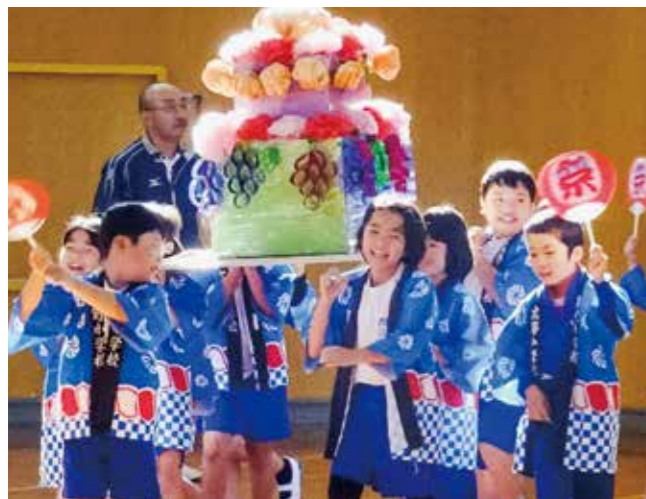
↑お神輿を担ぐ1・2年生

11月1日と5日は学校公開日でした。たくさんの保護者の皆さんがおいでくださいました。そんな中、1・2年生はお祭りを行いました。お神輿の入場から始まり、その後それぞれの出店で保護者の皆さんを出迎えました。魚釣りやペットボトルキャップ積み、ボウリングなど楽しいものばかりでした。保護者の皆さんに来ていただき、子どもたちもとても喜んでいました。