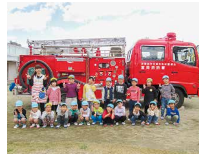
↑大きな消防車の前でニコリ笑顔の5歳児さくら組さんです

11月、消防署の方々と一緒に防火訓練を行いました。消防署の方からは、避難の際には『お・か・し・も』の約束を忘れずにとのお話をいただきました。今後の避難訓練でも生かしていけるようにしたいです。また、先生たちによる消火訓練も「がんばれー!」と必死に応援してくれた子どもたちでした。