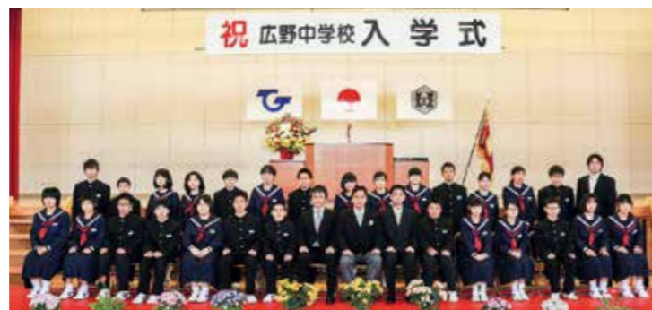
←入学式後記念撮影する新入生

4月8日(月)、平成31年度入学式が5年ぶりに本校体育館で挙行されました。本年度の入学生は27名です。新入生は新しい制服に身を包み、引き締まった表情で式に参加していました。担任の先生からの呼名にも大きな声で返事をするなど、中学生としての新たな決意を感じさせるすばらしい式となりました。