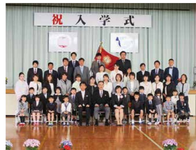
↑入学式後みんなで記念撮影する1年2組

4月8日(月)広野小学校の入学式が同校体育館で行われ、かわいい33名の新入生を迎えることができました。一日もはやく慣れて、楽しい学校生活を送ってほしいと思います。