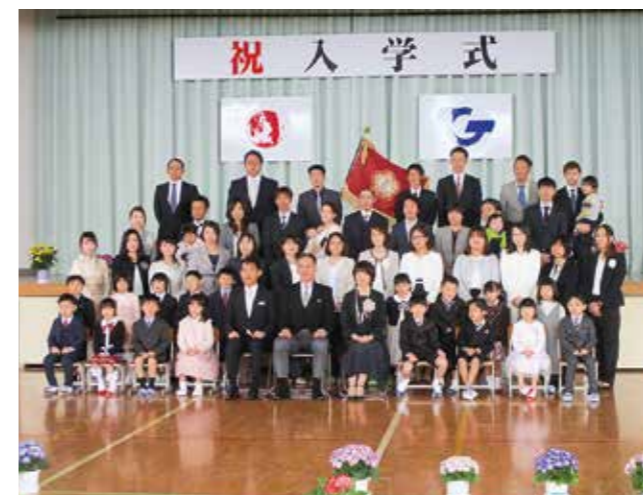
↑入学式後みんなで記念撮影する1年1組