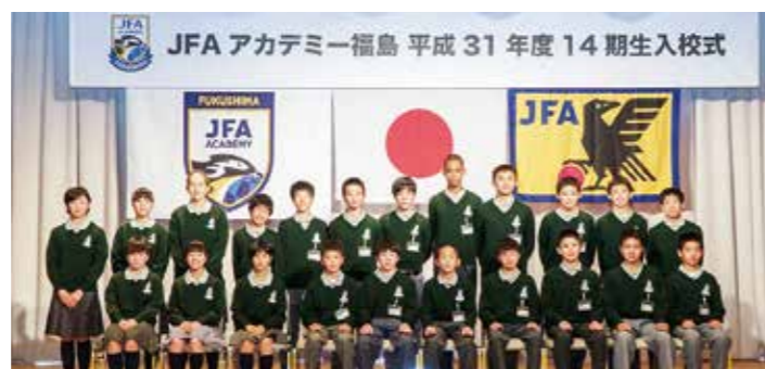
←入校式に臨んだJFAアカデミー第14期生