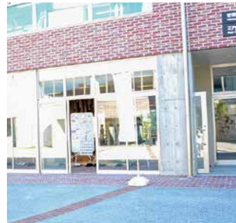
↑ここからお入りください