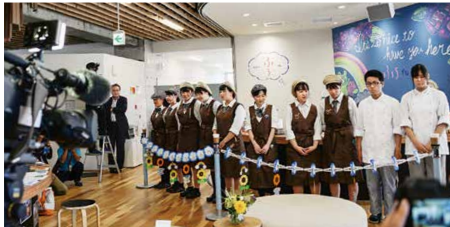
↑私達がスタッフです