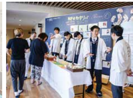
↑土産品コーナー (未来学園生が商品開発した商品)