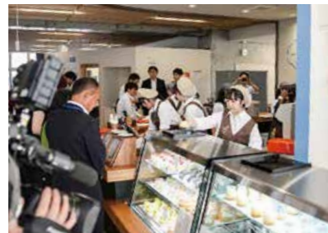
↑ケーキもいっぱい