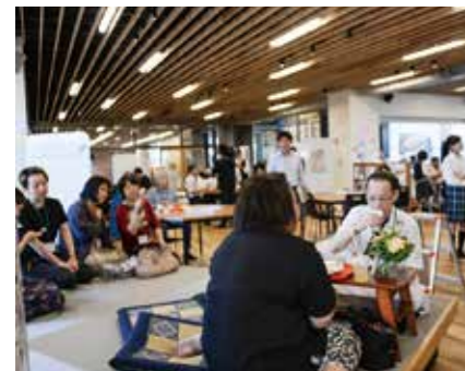
↑テーブル、椅子、座敷もあります