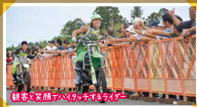
観客と笑顔でハイタッチするライダー