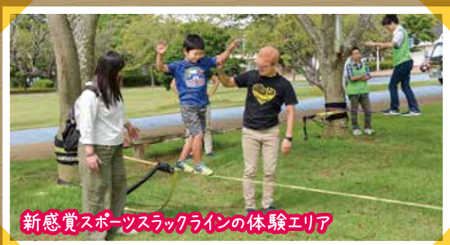
新感覚スポーツラックラインの体験エリア