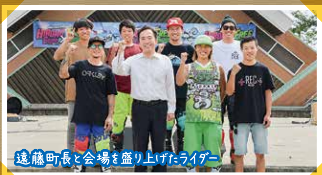
遠藤町長と会場を盛り上げたライダー