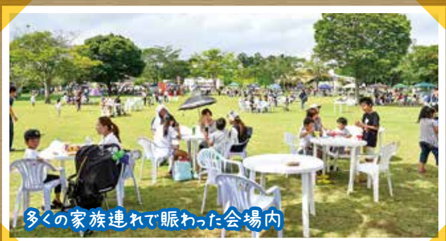
多くの家族連れで賑わった会場内