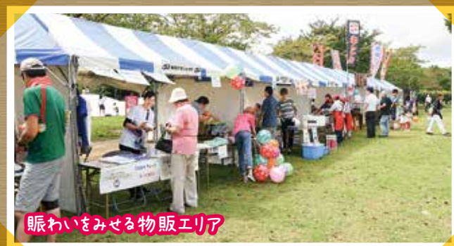
賑わいをみせる物販エリア