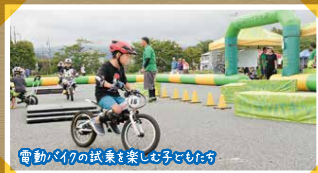
電動バイクの試乗を楽しむ子どもたち