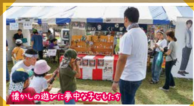
懐かしの遊びに夢中な子どもたち