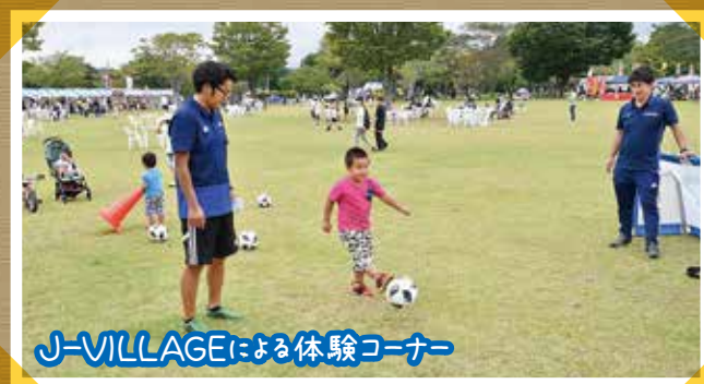
J-VILLAGEによる体験コーナー