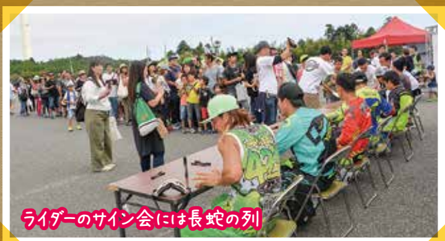
ライダーのサイン会には長蛇の列