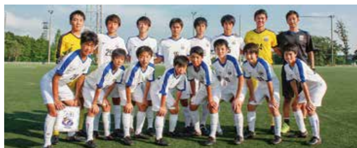
←試合経験を積んで全国を目指す選手たち