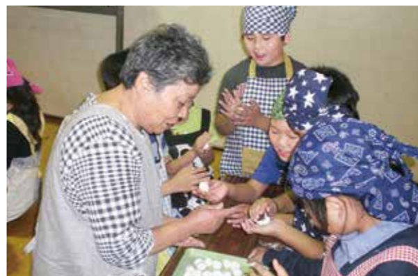
←みんなで楽しくお団子作り♪