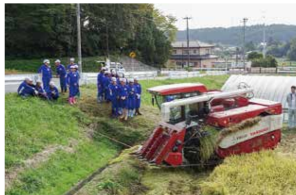
←震災後初の田んぼ学習を実施

10月16日、5年生が総合的な学習の時間に、5月に田植えをした田んぼの稲刈り体験と見学をしました。稲は一人1把だけ鎌で刈ってみる体験をした後、機械で刈る様子を見学しました。子どもたちは、あっという間に刈ってしまう機械に驚いていました。今年度は、震災後、初めての田んぼ学習ができました。ご協力いただいた地域の皆さまありがとうございました。