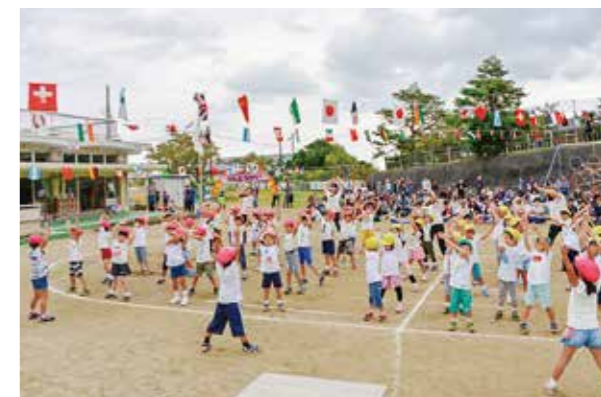
←笑顔いっぱい準備体操!

9月29日、幼稚園園庭での最後の運動会を行いました。天気も心配されましたが、元気な子どもたちのパワーでお天気回復!最後まで競技を行うことができました。お遊戯にかけっこ、大好きな家族との競技など、子どもたちはちょっぴり緊張しつつも、笑顔いっぱいでお楽しみしていました。楽しかった思い出でまた少し成長できたかな…☆