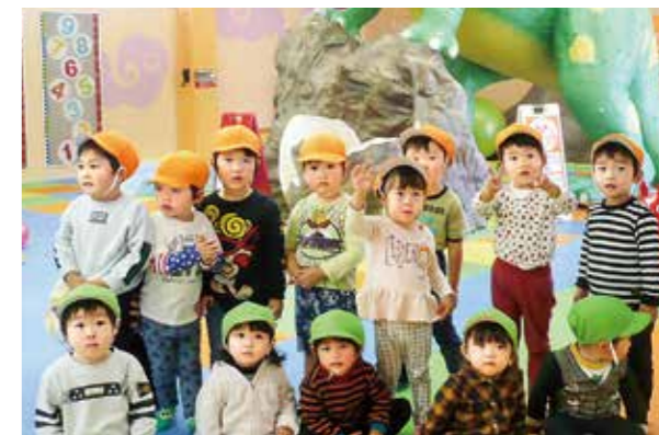
←みんな遠足楽しいね♪

10月25日、いわき海流の里センターへ行ってきました。屋内遊び場(いわきずるん)で遊んだり、戸外を散策したりしました。