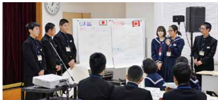
←カナダと日本の違いについて発表した生徒たち

10月14日、公民館で開催された「第5回国際フォーラム」に本校2年生が参加し、この夏の海外研修での成果を報告しました。