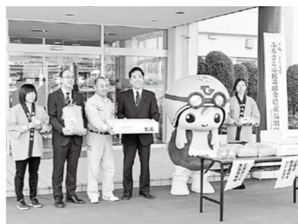
ふるさと応援寄付金に対する発送式

10月22日、広野町公民館において広野地区ほ場整備事業の地区別総会が開催され、相双農林事務所より現在の進捗状況ならびに今後のスケジュールが説明されるとともに、事業を実施する上での各種基準、価格などの議案につ