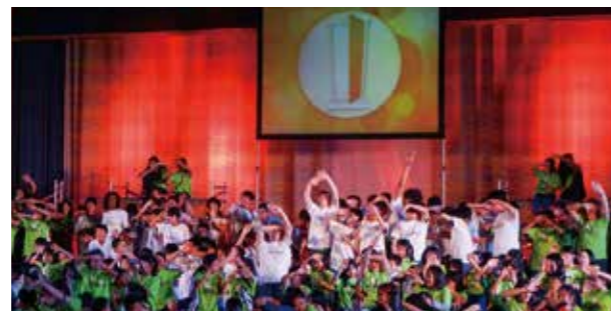
←熱狂に満ちる会場

11月8日、9日に2日間、ヤングアメリカンズワークショップを実施しました。9日には2日間のワークショップを終え、夕方からヤングアメリカンズと小中学生、教職員によるショーが繰り広げられました。2日間で素晴らしい歌やダンスショーを仕上げ、改めて子ども達の素晴らしさを感じました。