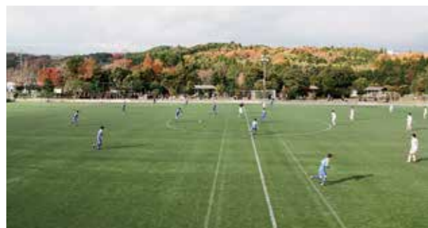
←目標に向かって日々奮闘