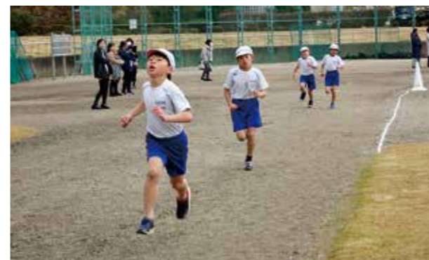
←ゴールを目指し、頑張りました

11月28日、持久走記録会が総合グラウンドで行われました。子どもたちはこの日のために体育の時間はもちろん、大休憩なども使って一生懸命練習してきました。新記録や自己ベストの記録が続出し、練習の成果を十分に発揮することができました。