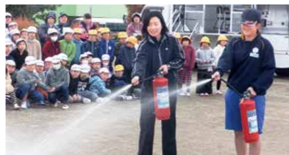
←正しい消火器の使い方を学ぶ生徒たち

12月1日、小中合同の避難訓練を実施しました。家庭科室からの出火を想定し、全員が校庭に避難しました。東日本大震災の経験を持つ生徒たちは、真剣に避難することができました。