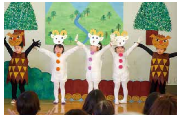
←三びきのやぎのガラガラドンとトロール

12月9日、保育所にてお遊戯会が行われました。劇遊びでは、大きな声でセリフを言って堂々と披露することができた3歳児です。「上手だったよ」と褒めてもらい、にっこり笑顔のぞう組の子どもたちでした。