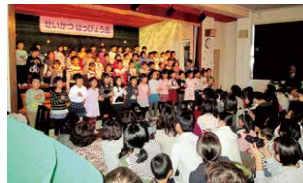
←大きな声で発表する園児たち

12月2日、幼稚園の生活発表会を行いました。リズムに乗って踊ったり、劇で役になりきったりと練習の成果を十分に発揮し、緊張せずに楽しめたようです。