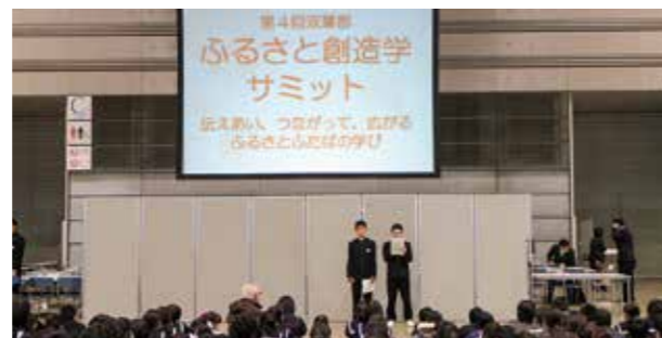
←活動の発表をする生徒たち

12月9日、双葉郡8町村の学校による第4回ふるさと創造学サミットがピックパレットで行われました。同イベントは地域を題材とする学習活動であり本校では1年生全員と生徒会役員が参加し、今年度取り組んできた映画制作を通して、広野町について学んできたことを発表しました。