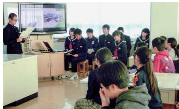
←先輩の話を真剣に聞く児童たち

12月15日、次年度の入学を予定している児童や保護者の皆さんのために入学説明会を行いました。校長先生の挨拶の後、先輩の授業を参観し、英語の授業を体験しました。説明会では、生徒会役員や部活動の部長たちが中心となって、学校生活について具体的な説明を行いました。児童の皆さんは、真剣に話を聞いていました。