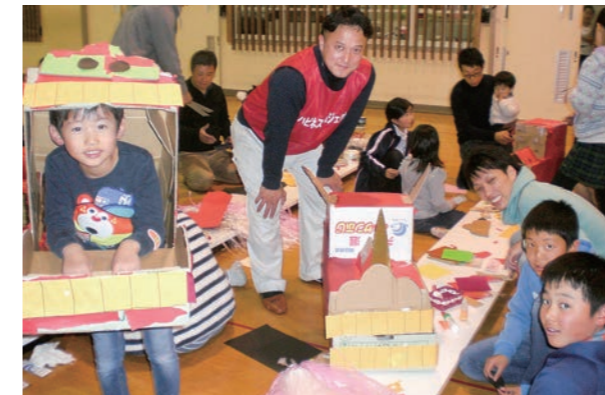
←上手につくれたよー

12月19日、子ども達は、新年を祝う華やかな獅子舞を作りました。強そうな獅子舞にしようがんばる子ども達にボランティアの方々もサポートしてくれ、仕上げることができました。1年の始まりを御獅子と一緒に楽しく迎えましょう。