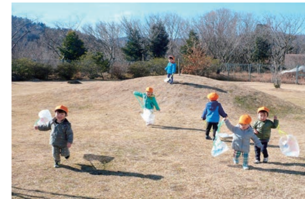
←風さん、もつとふいてー

1月、お友だちと一緒に自分で作った凧を握りしめ、「たーこー たーこー あ〜がれ」と歌いながら、冷たい風にも負けず、所庭で元気いっぱい凧揚げを楽しむ子どもたちでした。