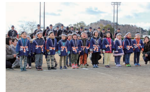
←元氣よく言えました

1月14日、21人の園児が広野町消防団・婦人消防隊のパレードと出初め式に参加しました。寒空の中、パレードでは元気に行進し、出初め式では大きな声で防火宣言ができました。頑張ったご褒美にひろぼーと写真を撮ったり、消防車に乗せてもらいました。