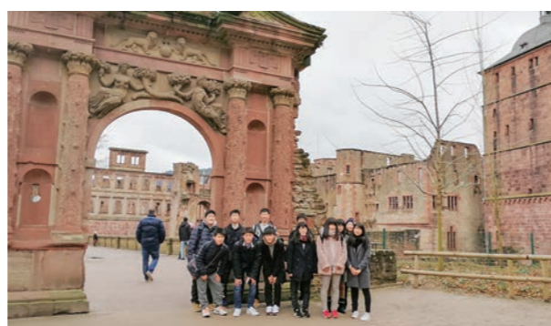
←ハイデルベルク城門前で記念撮影