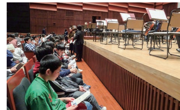
←オーケストラ鑑賞会の様子

12月20日、「ボクとわたしのオーケストラ」がいわきアリオスで行われ、5・6年生が参加してきました。迫力のある演奏や豊かな音色の演奏にどっぷりと浸り、あっという間の1時間でした。大きなホールで生のオーケストラの演奏を聞くことができ、音楽の楽しさや素晴らしさを体感できたひとときとなりました。