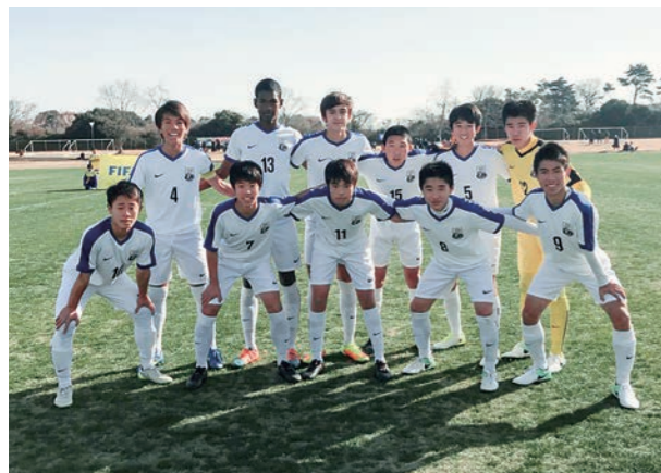
←ユースでも頑張るぞ