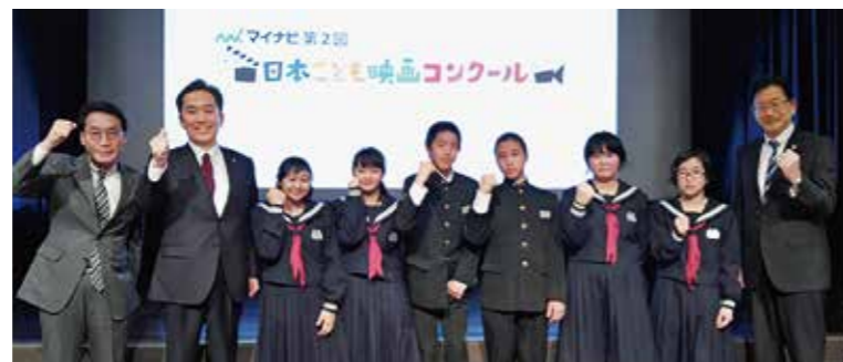
←入賞を祝って記念撮影

2月17日、第2回こども映画コンクールの表彰式が東京都内で行われ、広野中学校1年生が制作した「未来へ昇れ！昇竜太鼓」が同コンクールで入賞したことから、制作した生徒らが出席しました。