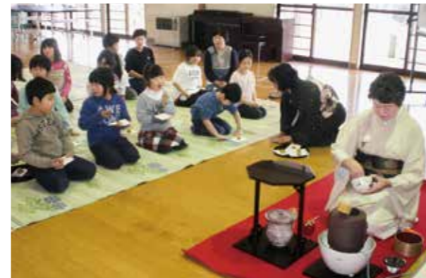
←礼儀作法も身に付ける子どもたち

2月23日、子どもたちは、少しあらたまった気持ちでおいしいお菓子と抹茶をいただきました。茶の湯を楽しむ子どもたちに「おもてなし」の心が伝わったようです。思い出に残るひとときになりました。