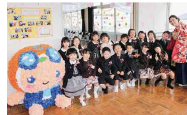
←式後にみんなではい、チーズ

3月19日、幼稚園の修了式が行われました。5歳児のつぎ組16人の元気な子どもたちが修了しました。子どもたちの思い出が詰まったおわかれの言葉に胸がいっぱいになりました。また、今年度は修了記念製作にお花紐でひろぼーを作りました。