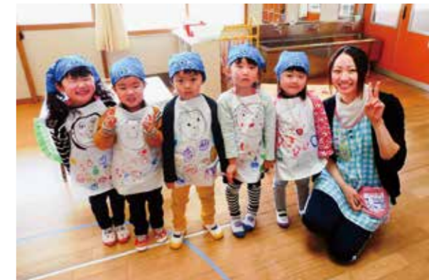
←品物完売に笑顔の子どもたち

3月、自分たちで品物を作りお店やさんごっこをしました。小さいクラスのお友だちと品物の受け渡しを楽しみながら、みごと完売です。