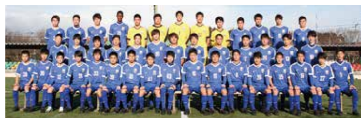
←Aリーグ昇格に向け 気合い十分