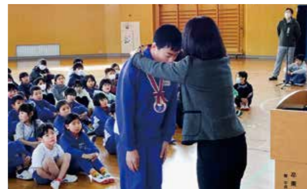
←メダル伝達の様子

2月20日、お昼休みに全校集会を開き、福島県書き初めコンクールで特選になった児童や福島県算数・数学ジュニアオリンピックで銅メダルを獲得した児童に賞状やメダルの伝達を行いました。その後、校長先生より平昌オリンピックの選手の頑張り触れ、応援しながら、自分の頑張る心やあきらめない心も振り返ってみましょうという話がありました。