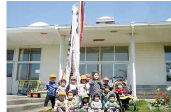
←みんなで仲良く遊ぼうね

14人でスタートした保育所での生活。1か月が経ち、ここに笑顔が増えてきました。お友だちや先生と遊ぶのが大好きな子どもたちは、青空の下で元気いっぱい遊んでいます。