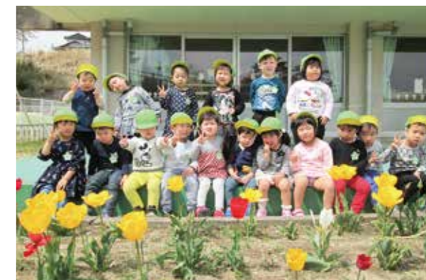
←満開のチューリップと一緒にハイチーズ

新学期が始まり、暖かい日が続きました。子どもたちの元気な笑顔に園庭のチューリップも嬉しそうに満開です!!今年度は新入園児24人、進級児43人の計67人で一年間元気いっぱい頑張ります☆