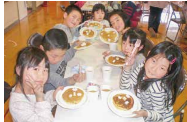
←おいしいホットケーキいただきます

1年生の歓迎会をかねてホットケーキ作りをしました。1年生はみんなで生地を作り焼きました。もちろん、お兄さんたちもお姉さんたちも上手に焼きました。バターとシロップ、クリームをのせておいしそう♪『いただきます〜』