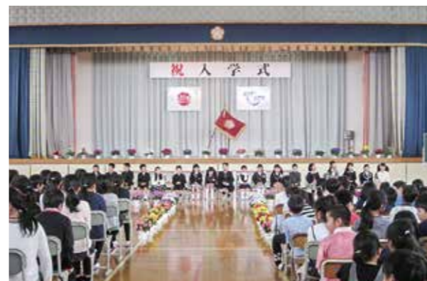
←初めての学校生活にワクワクドキドキ

4月6日、広野小学校の入学式が同校体育館で行われ、かわいい18人の新入生を迎えることができました。一日も早く学校生活に慣れ、楽しい学校生活を送ってほしいと思います。