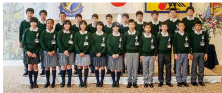
←入校式に臨んだJFAアカデミー第13期生