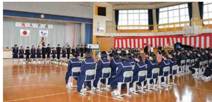
←中学校生活がスタートした新入生

4月6日、広野中学校の入学式が広野小学校体育館で行われました。新1年生は16人で、全校生徒は66人になりました。上級生から歓迎のことばを受けたあと、新入生代表が誓いのことばを述べました。新入生は、緊張の中にもこれからの中学校生活に対する期待で目を輝かせていました。