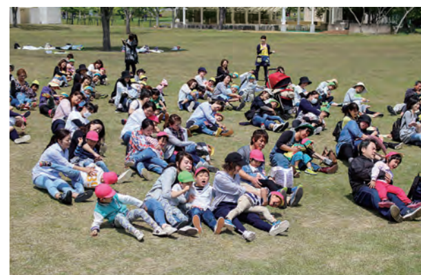
←親子一緒に楽しい時間を過ごしました

5月11日に親子遠足を行いました。二ツ沼公園で親子ふれあい遊びを楽しんだり、体を動かしたりして楽しく過ごす姿が見られました。子どもたちは元氣いっぱい走り回って良い思い出になったと思います。とてもさわやかな青空の下、おいしいお弁当後のおやつ交換も盛り上がっていました♪