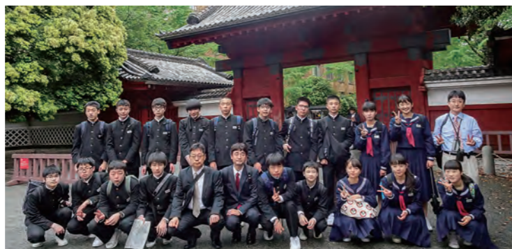
←東京大学赤門前で記念撮影

4月24日から2泊3日の日程で、3年生19人が関東方面へ修学旅行に行ってきました。鎌倉・横浜・東京での班別自主研修では歴史や文化に触れ、見識を深めてきました。また、東京大学の特別セミナーに参加し、現役の大学生との交流を通して、自分自身の未来について考える貴重な体験をしてきました。クラスの団結力もさらに高まり、一生の思い出に残るすばらしい修学旅行となりました。