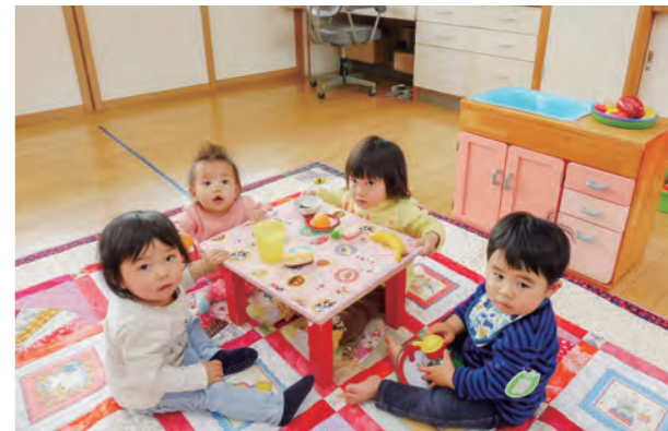
←お茶会みたくて楽しいね♪

0・1歳児はままごと遊びが大好きです。この日は、雨降りだったので、暖かいキルトマットを敷いて遊びました。ポットでお茶を注ぐ真似をしたり、お皿にケーキを置いたりお茶会気分を味わいました。