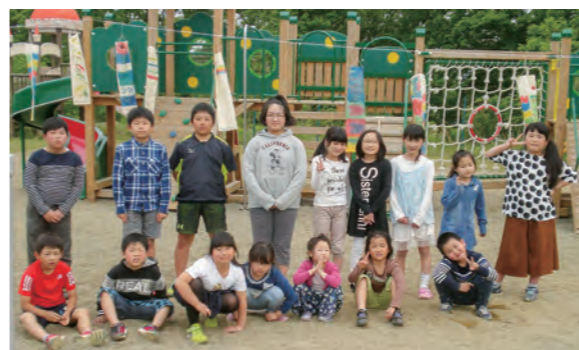
←個性いっぱいこのこいのぼりができました

今年も澄み渡る青空いっぱいにこいのぼりが泳ぎました。絵の具で色や模様を付けた、自分だけの自分らしいこいのぼり♪子どもたちには大空を泳ぐこいのぼりのように、のびのび元氣いっぱい育ててほしいですね。これから、海を渡り、ドイツの空を泳ぐ予定です。