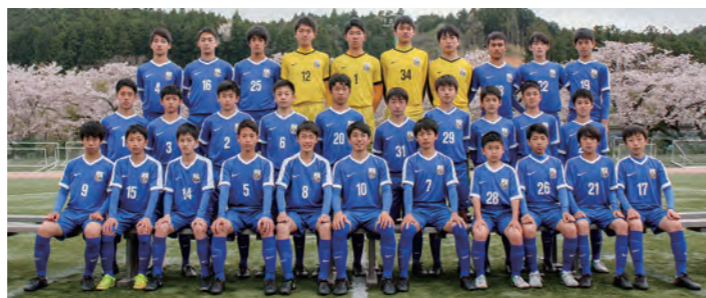
←勝利を目指して頑張っています