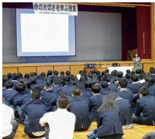
↑命の大切さを改めて確認する生徒