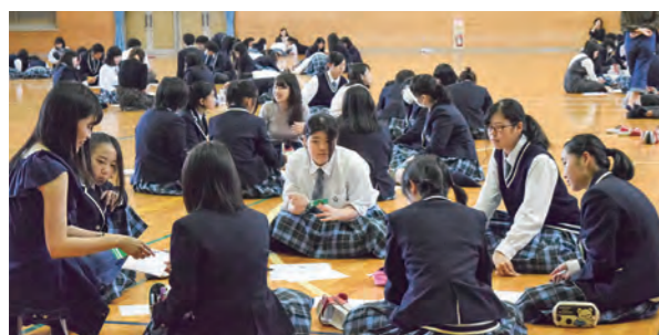
←先輩の話真剣に聞く生徒たち