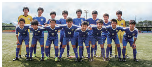
←開幕戦勝利にチームは笑顔