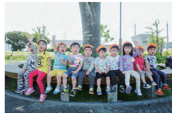
←公園へお散歩楽しいね♪

暖かくなり所庭やグラウンドなどで遊ぶことが多くなりました。友達や先生と手を繋いで「お花キレイだね」「風吹いているね」などとお話をしながら、お散歩にも行っています。毎日お外で遊ぶことを楽しみにしている子どもたちです。