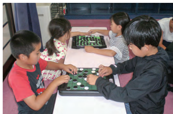
←子どもたちはオセロに夢中です

5月末からオセロ大会がスタートしました。低学年・高学年の部に分かれ熱戦が繰り広げられています。勝って喜ぶ子、悔し涙を流す子、友だちを一生懸命応援する子など、見てのこちらも胸の熱くなる素晴らしい大会です。