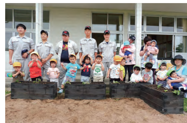
←高校生のお兄さんたちありがとう!

6月6日、子どもたちは、ふたば未来学園高校の生徒5人と一緒にサツマイモの苗植えをしました。子どもたちは高校生の補助を受けながら、1株ずつ手作業で苗を植えました。苗を植えたあと、「おおきなぁーれ!」と言いながら水やりをしました。秋の収穫が楽しみです。