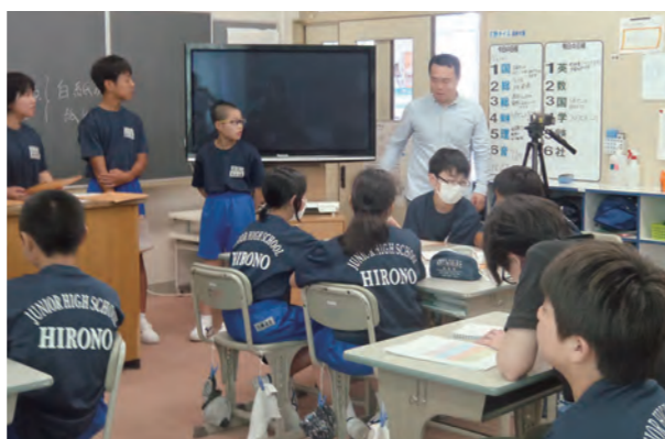
←映画作りを通して多くを学ぶ生徒たち

6月13日、広野町映像教育実行委員会のスタッフの方をお招きして、映像制作の授業を行いました。1年生の総合的な学習の時間では、「ふるさと創造学サミット」の理念に基づき、ふるさとの「ひと・もの・こと」を教材に映像制作を中心として探求活動に取り組み、ふるさとへの愛着を深める学習をしています。今後はグループごとに計画に従って映画作りを進めていく予定です。