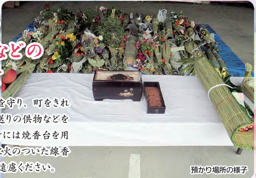
預かり場所の様子

町内の河川と海岸の環境を守り、町をきれいにするために、今年も盆送りの供物などをお預かりします。預かり場所には焼香台を用意します。また、供物の中に火のついた線香をさしたままの持ち込みはご遠慮ください。