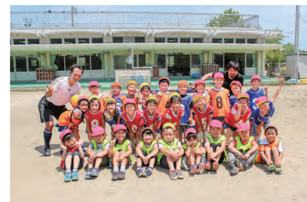
←気分はサッカー日本代表！

7月3日に幼稚園の園庭でサッカー教室を行いました。はじめはボールに逃げられたり、手で拾いに行ったりとなかなか難しいかなあと思いましたが、後半のミニゲームでは諦めずにボールを追いかけたり、ゴールを狙ってシュートを打つかっこい姿が見られました。数年後、ブルーのユニホームでボールを追いかける姿が見られますように…☆