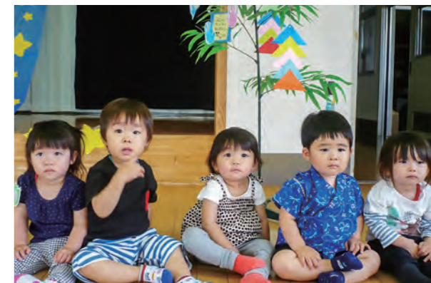
←願いが叶うといいなあ