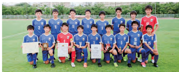
←東海大会での悔しさや全国大会にぶつけます