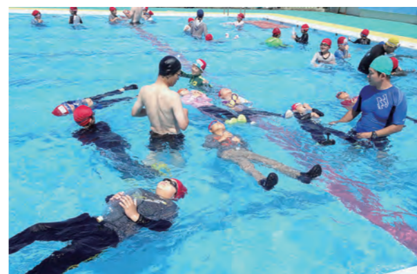
←上手に水に浮きました

7月9日、水難学会の皆さんによる「浮いて待て講習」が行われました。万が一、海や川で水難に遭遇したときに救助されるまで自分で身を守らなければなりません。ペットボトルを持って上手に水に浮いて救助を待つ練習をしました。低学年の児童は、ボランティアの保護者の皆さんにも協力してもらいました。