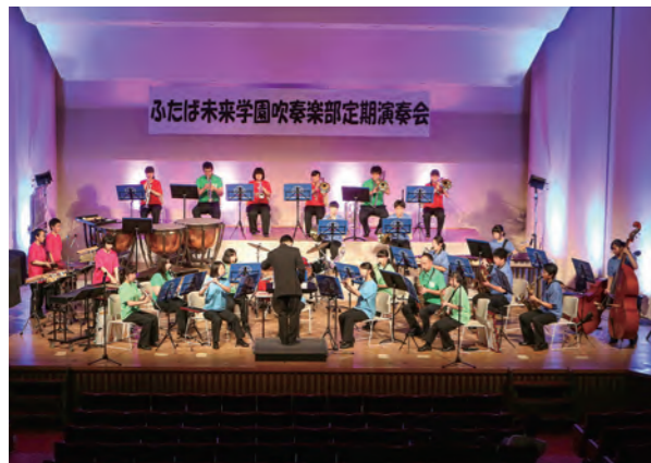
↑双葉郡内で初開催となった定期演奏会