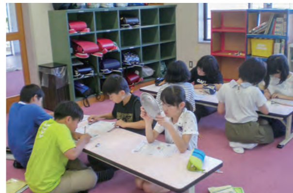
←勉強も遊びも全力で！

「ただいまー！」と挨拶をして、小学校から元気に戻ってくる子どもたち。児童館は宿題からスタートします。自分の力で!!を目標に最後まで諦めずに集中して頑張っています。宿題が終わったら、お迎えがくるまで自由遊びです。ドッジボールや将棋、お絵かきなどをしてお友だちと楽しく過ごしています♪