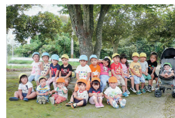
←木の下でちよつと休憩!

9月11日、お友達と手をつなぎ、仲良くお散歩に出かけました。キンモクセイの香りやまだ小さなどんぐりを見つけたら、たくさんの自然にふれました。「また、みんなでおさんぽ」と、笑顔の子ども達でした。