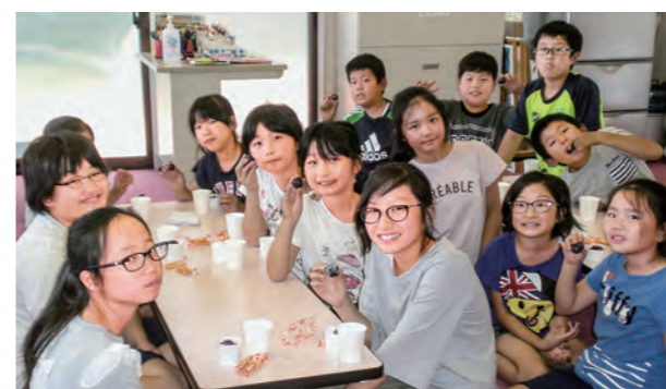
←次のおやつも楽しみ!

9月8日、お友達と一緒に食べるおやつは、毎日楽しみのひとつ。今日は、人気のぶどうをパクリ。思わず、おいしくて笑顔が広がります。今月、秋の実りがいっぱいのおやつに子どもたちもワクワクしそうです。