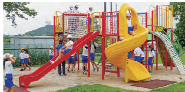
←新しい遊具に大喜び

8月28日、授業も本格的に始まり、子どもたちは真剣に先生や友達の話聞いて学習に取り組んでいました。また、複合遊具施設も新設され、大休憩時は各学年で使い初めをしていました。学習も遊びも充実させ、2学期も楽しく学校生活を送ってほしいです。