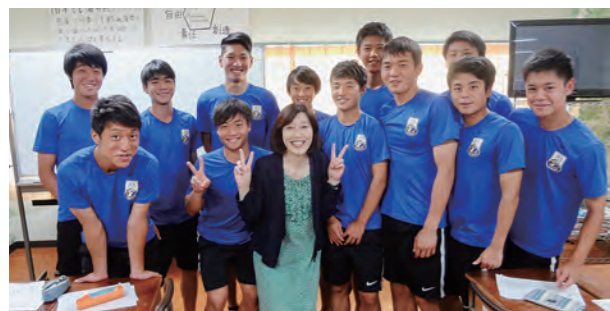
←大切な仲間との絆