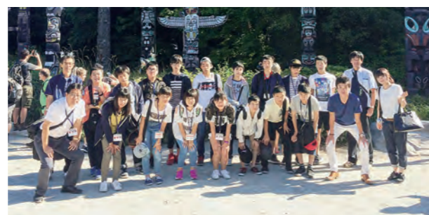
←カナダでいろいろ学びました

8月16日から23日まで、広野町の海外教育交流派遣(カナダ研修)を行いました。中学2年生16人と5人の引率者がバンクーバー、ケロウナなどで研修やホームステイを体験しました。たくさんの方を学び、今後の人生に生かせる実り多い研修となり、23日、無事元気に帰国しました。10月に報告会を行います。