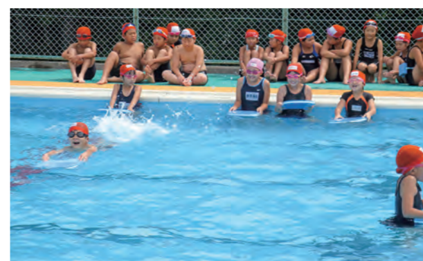
←水泳記録会の様子

9月4日、延期となっていた水泳記録会が行われました。今年は天候の影響で、十分な水泳学習とはいきませんでした。今年まで学習したことを発揮するため、みんな一生懸命記録に挑戦しました。後日、水泳記録証が手渡されます。