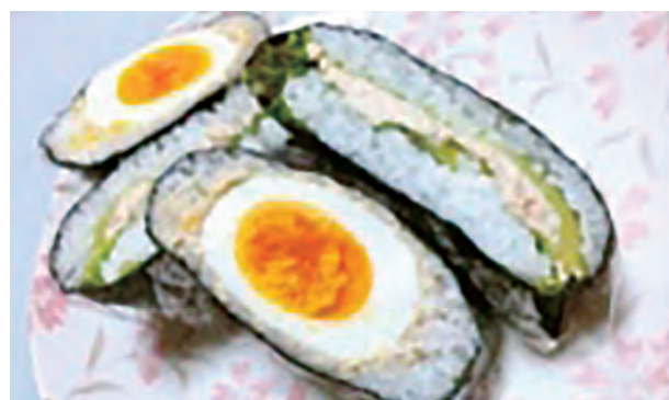
←いわなを使ったオリジナルレシピ