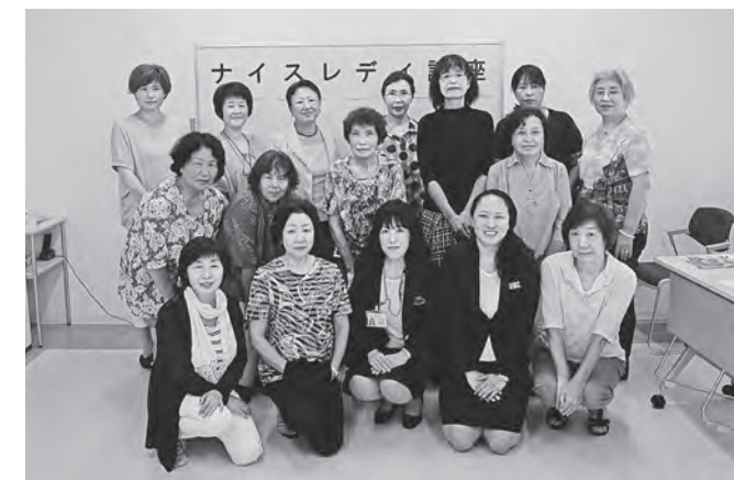
講師を囲んで記念撮影

私は当初、講義内容を目にした時、おおむね終活期にある私に参考になる事例があるのかとの思いで聴講しましたが、「お金」の話は奥が深く、人生最後迄賢く付き合わなければならない事を学びました。シニア世代も大いに「シニア割引活用術」を身に付け、旅行や趣味を楽しんではいかがでしょうか。