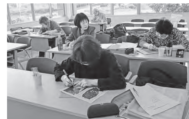
切り絵作品作りに励む教室生

皆さんも一度、公民館で切り絵を楽しんでみませんか。毎月第二と第四土曜日に教室開催されております。お待ちしております。