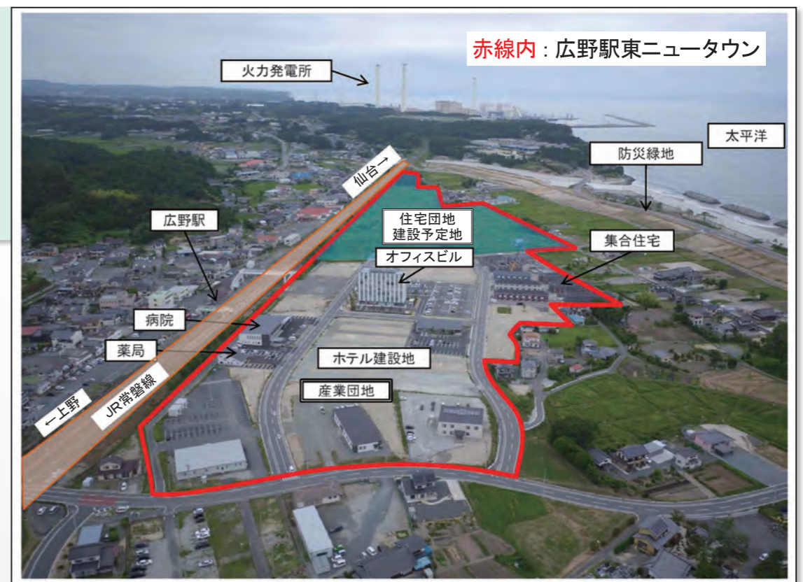
復興ゾーン現況写真