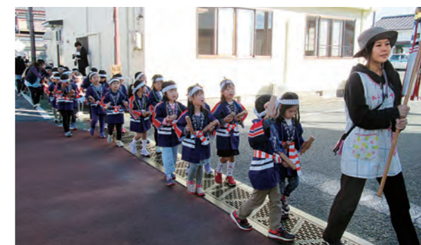
←大きな声で「火の用心！」

11月16日、防火パレードを行いました。ハッピーと拍子木で気分はすっかり消防団。町の中を「火の用心！」と大きな声で防火を呼びかけてきました。いつものお散歩よりちょっぴり疲れたけど、寒さも吹き飛ばす子どもたちの元気な声が響いていました。