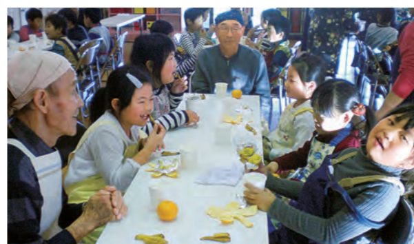
←スイートポテトおいしいな！

11月17日、サツマイモを使って、おじいさんたちとどきりおいしい「スイートポテト」を作りました。ゆであがった芋をつぶし、サツマイモの形にしてオーブンで焼き、みんなで会食しました。おじいさん、おばあさんとの会話ははずみ、子どもたちも幸せいっぱいでした。