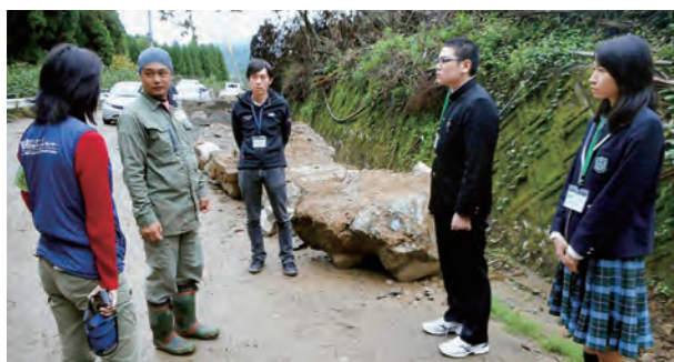
←現地の人から現況を聞く生徒たち