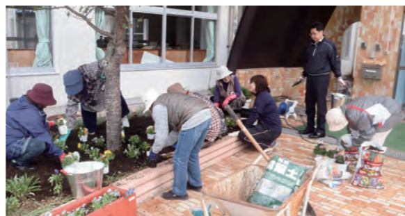
←赤十字奉仕団の方々 花いっぱい運動で汗を流す

10月25日、広野町赤十字奉仕団の方々による第2回花いっぱい運動が行われました。この運動は今年5月にも行われ、いつも校舎の玄関前はきれいな花で飾られ、子ども達の素晴らしい学習環境となっています。お越しの際は、ぜひ、玄関前のきれいな花をご覧ください。