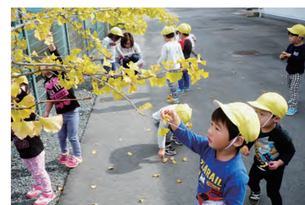
←イチョウの葉で遊ぶ子どもたち

イチョウの葉で元気に遊ぶ子ども達。たくさん集めて「それ！」と空へ。イチョウの葉が風で舞い、とっても綺麗でした。自然は子ども達にとって宝の山ですね。色とりどりの葉っぱを集めるのに夢中です！