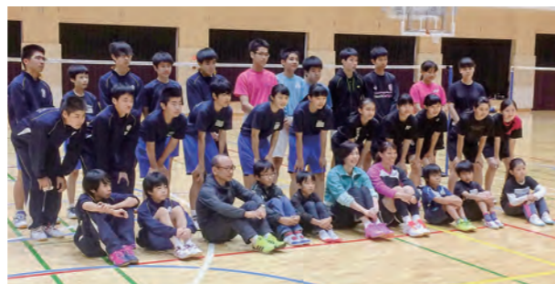
←講師の方々との記念撮影

10月22日、檜葉町主催「バドミントン教室」が開催され、本校バドミントン部も参加させていただきました。