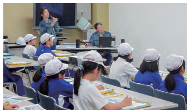
←熱心に話を聞く生徒たち

10月31日、5年生の総合的な学習の時間で広野火力発電所の見学を行いました。広大な敷地をバスでまわり、施設の説明を受けるとともに、発電の仕組みについて学習しました。間近で見る巨大な煙突や燃料タンク、また、126万軒分の電力を作ることができることに子ども達は驚いていました。