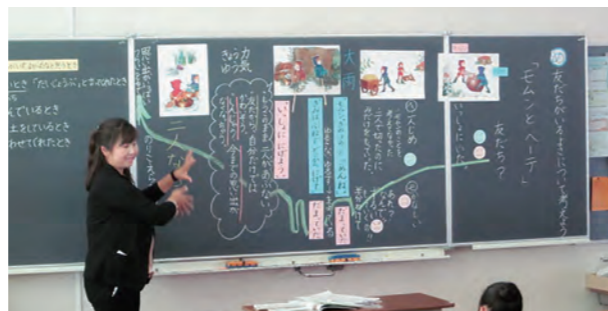
←道徳の授業の様子

10月27日、2年1組で他校の教職員も参加して道徳の授業研究会が行われました。友情・信頼について考える授業で、物語を通して友達がいることのよさについて話し合いをしました。最後に、保護者に協力していただいたアンケートの話を聞き、子ども達は友達の大切さを改めて実感することができました。