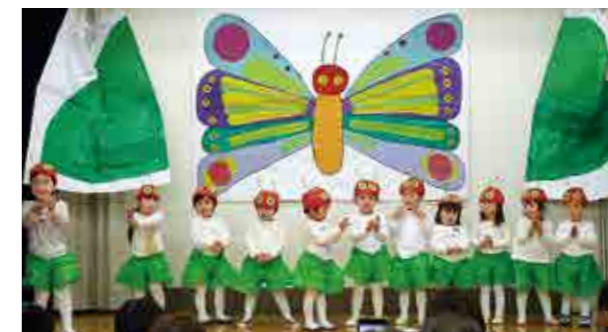
←かわいいチヨウチヨに変身

12月10日、お遊戯会を行いました。2歳児たんぽぽ組のお話し遊び「はらぺこあおむし」です。11匹のかわいいあおむしさんが蝶々になる場面です。みんな上手に演じていました。