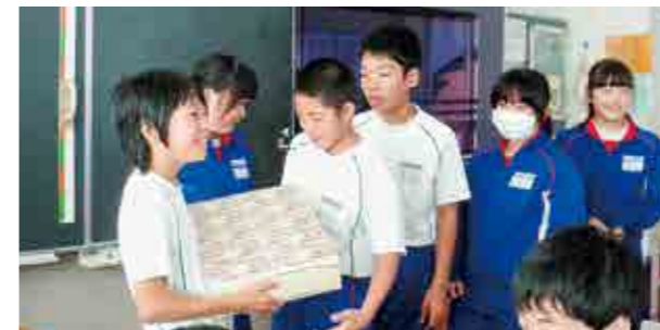
←1億円の重さに驚く児童

12月5日、6年生の社会科で、公益社団法人相双法人会の方々による租税教室が行われました。DVD視聴により、税金はなぜ必要なのか、どんな税金があってどのように使われているのか等を学習しました。小学生が学校生活を送るのに、一人あたり1ヶ月で約7万円の税金が使われているのだそうです。また、一人ひとり1億円（レプリカ）の重さについても体感することができました。