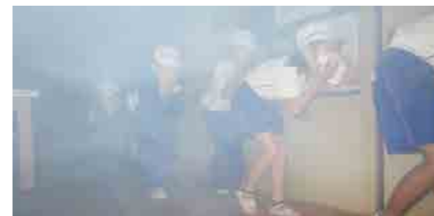
←煙体験ハウスでの訓練

12月1日、小中学校合同で第2回避難訓練を行いました。家庭科室から出火したという想定のもと、児童生徒は、放送をよく聞いて速やかに体育館へ避難することができました。広野中の校長先生や富岡消防署の方から、「押さない」「駆けない」「しゃべらない」「戻らない」の4原則をしっかりと守るようお話がありました。その後、図工室での煙体験を通して、煙の中では見えにくく歩行が困難になること、その中をあえて進むにはハンカチで口を覆いなるべく姿勢を低くして進むこと、を学ぶことができました。