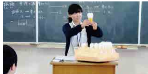
←模型で説明する講師

12月8日、相双保健福祉事務所の先生方をお招きして、歯科健康教室を全学年で実施しました。生徒たちは、虫歯や歯周病予防の大切さを学び、歯肉の観察方法や歯垢を取り除く歯磨きの仕方を再確認しました。「生涯、自分の歯で食べよう!」が今日のテーマでしたが、今日教えていただいた歯磨きを毎食後に実践し、健康な体づくりにもつなげていって欲しいと思います。