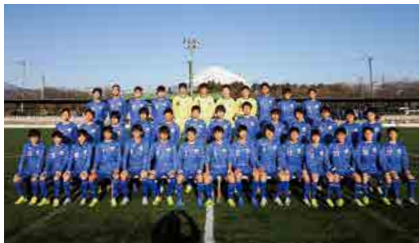
←プレミアリーグ参入戦に挑む6期生