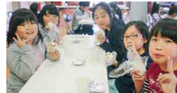
←作った肉まんをほおぼる子どもたち

11月16日、子どもたちは、ジュシー肉まんを作って大喜び。広野町食生活改善推進協議会の方々に教えていただき、おいしいおやつが出来上がりました。食パンを使った肉まんに「おいしい!」とみんな大満足でした。