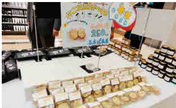
←ざらりと並んだ新商品