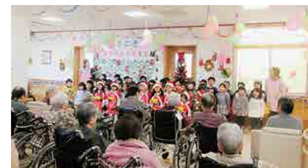
←小さなサンタに感激

12月9日、花ぶさ苑で歌や踊りを披露してきました。かわいい子どもたちの姿に感激されている方もいました。最後にはサンタさんが登場し、プレゼントをいただき笑顔の子どもたちでした。