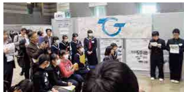
←映画制作の紹介をする生徒

12月3日、双葉郡内の小中学生が、それぞれの地域について学習した成果を発表し合う「第3回ふるさと創造学サミット」がビッグパレットふくしまで開催され、本校からは1年生と生徒会役員3名が参加しました。1年生は、ひろの映像教育実行委員会と町民の皆様のご協力により制作した地域を紹介する映画づくりについて発表しました。生徒会役員は、他校の生徒会と協力して、交流イベントの運営に携わりました。それぞれの学校によさを伝え合うことができ、充実した時間を過ごしました。