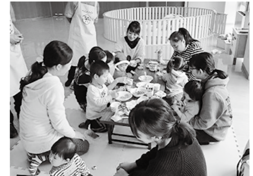
げんキッズの様子

☆内容：お話ししたり、遊んだり自由に過ごしてください。おもちゃや絵本はお貸しします。