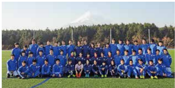
←目指せプレミアリーグ