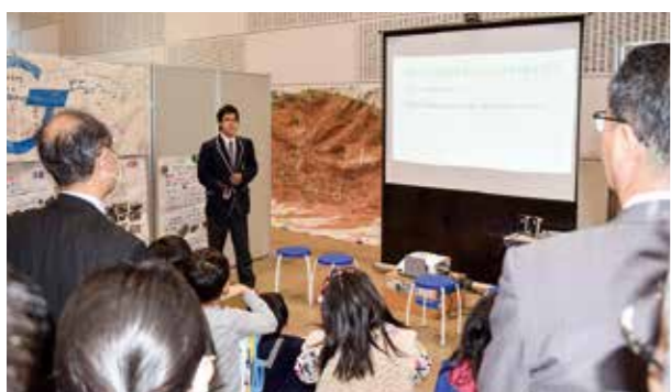
←未来創造探究の活動について紹介