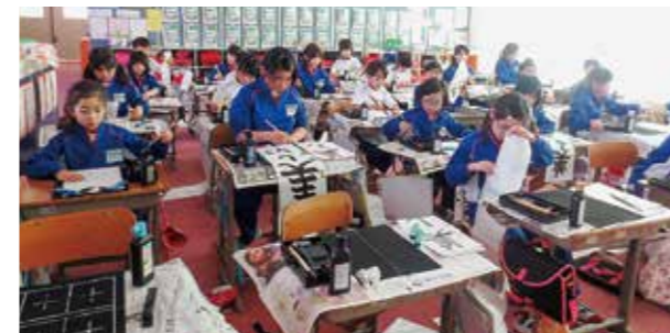
←姿勢を正し力強く書き初め

1月12日、今日は、各学級で校内書き初め会が行われました。1・2年生は硬筆を、3年生以上は毛筆を行いました。姿勢を正し集中して1枚1枚を丁寧に書き上げていきました。どの子も大きく伸び伸びと勢いのある字を書いていた。後日、作品は校内で展示し、優秀作品には賞状を授与します。