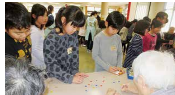
←広桜荘訪問の様子

1月17日、3年生が福祉に関する授業で、広桜荘を訪問し歌やダンスを披露しました。お年寄りの方に手拍子をしていただき、子どもたちはノリノリで発表することができました。肩たたきをしてあげる姿も見られ、お年寄りの方に喜んでいただけて、子どもたちは大満足でした。