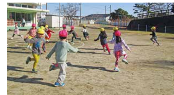
←みんなで遊ぶと楽しいね

1月10日、第3学期がスタートし、久しぶりに再会した友だちと園庭で元気に遊びました。子どもたちの歓声があがり園内に活気が戻ってきました。