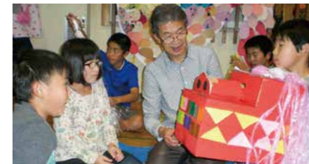
←立派な獅子舞が完成

12月22日、今年も子どもたちは、獅子舞作りにチャレンジしユーモラスな作品ができました。お手伝いのお兄さんたちと一緒にみかん箱に絵の具を塗り、折り紙で目や歯をつけ自分たちで形を作っていました。楽しかったようです。