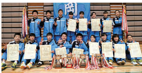
←快挙を達成したバドミントン部

今年のリーグ戦は1学年上の相手ですが、フィジカルやスピードでも負けられないようにチーム一丸となって戦っていきたくです。そして、1試合でも多く良い試合をして勝利したいです。