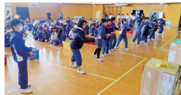
←豆まき集会の様子

2月3日、今日は節分、児童会活動で豆まき集会を行いました。校長先生のお話の後、集会委員の子どもたちから、「節分のいわれ」について説明がありました。次に、児童代表による追い出したい鬼の発表を行いました。これは、大声選手権も兼ねており、優勝者にはトロフィーが送られました。その後、「鬼つむつむゲーム」や年男年女の5年生による豆まきが行われ、みんなで楽しいひとときを過ごしました。ご家庭でも大きな声で豆まきを行い、福をたくさん呼び込んでほしいと思います。