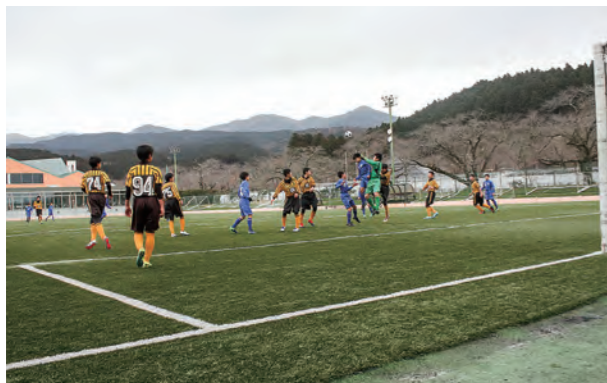
←各上を相手に奮闘中