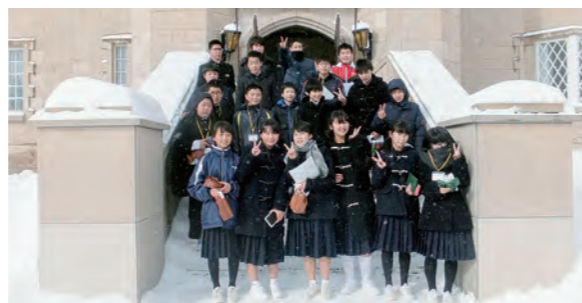
←英国の雰囲気味わった生徒たち

1月23日～24日の2日間、1泊2日の日程で、ブリティッシュヒルズでの異文化体験活動に参加しました。グローバル人材を育む小中連携英語教育推進事業の一環で、本校からは1年生20人が、広野小学校5年生と同じバスで行ってきました。ブリティッシュヒルズでは、入国審査からはじまり、さも英国にいるかのような施設設備の中で、英語を学び、コミュニケーションスキルの向上を図りました。英国風の施設とともに雪にも囲まれ、晴天続きの広野町との違いを感じながらの2日間でした。語学力とともにグローバルな視野を身に付けていくために、引き続き取り組んでいきます。