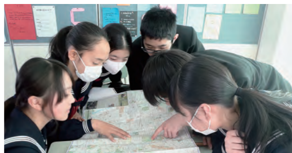
←自主研修の計画を練る生徒たち

2月2日、2年生は4月の修学旅行(関西方面)に向けて準備を進めています。今日は、地図やガイドブック、タブレットなどを活用しながら、メインとなる班別自主研修の計画をグループごとに作成しました。「出発地点から集合場所までどのようなところを見学するのか?」「昼食はどうするか?」など楽しそうに友達と話し合う様子が見られました。まだまだ時間が足りず、完成までは至りませんでしたが、今後何度かこのような時間を設けて完成させる予定です。4月の旅行が楽しみです。