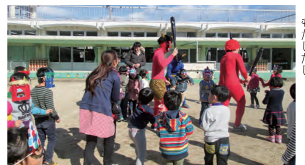
←子どもたちの勢いに鬼たちもたじたじ

2月3日、節分の日、園児たちは自作の鬼の面を交替で被り豆まきをしました。園庭に赤鬼や青鬼が現れると年少組の中には泣き出す子どももいましたが、年中・年長組のみんなは思い切り豆をまいて鬼を追い払いました。