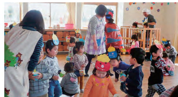
←大きな声で言えたかな

2月3日、豆まき会では、お話を聞いたり、みんなで一緒に「豆まき」の歌をうたった後、鬼に扮装した先生に、「オニは〜そと〜フクは〜うち〜」と元気に豆をまきました。子どもたちのおかげで鬼はすぐに逃げていき、たくさんの幸せが保育所にやってきました。