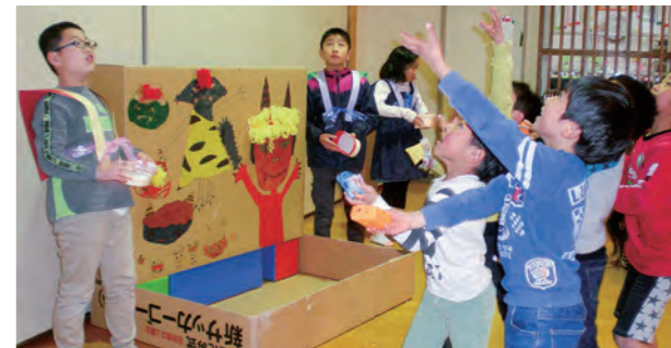
←豆まきを楽しむ子どもたち

2月3日、みんなで豆をまいて鬼を退治しました。豆まきももっと盛り上がるよう、今年は“かみしも風のコスチューム”で、福豆をまき、みんな楽しかったようです。春はそこまで来ています。