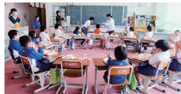
←給食調理員に感謝状を渡す児童

1月30日、全国学校給食週間の一つとして、広野町学校給食共同調理場の皆さんにお出でいただき、招待給食を実施しました。各教室にお一人ずつ入っていただき、給食委員会の児童より、日頃よりおいしい給食を作っていただいていることに対する感謝状贈呈がありました。その後、調理員さんを囲んでみんなで給食をいただきました。今日の献立は、赤魚の竜田揚げ、いか人参、ざくざく汁、中通りの郷土料理です。交流をしながらの給食は、一層楽しく、おいしい時間となりました。