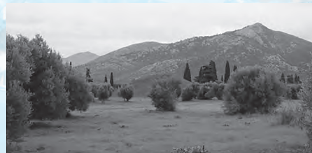
The battlefield today 現在のマラソンの戦場