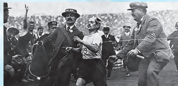
The finish line of the Olympic marathon, 1908 1908年のオリンピックマラソンゴールテープ