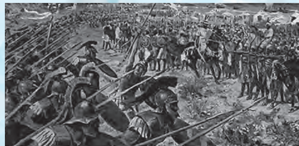
The Battle of Marathon マラソンの戦い

今年の2月に1万人を超えるランナーと共にいわきサンシャインマラソン大会に出た。応援していただいた皆さん、本当にありがとうございました。そして参加者の皆さん、お疲れ様でした！