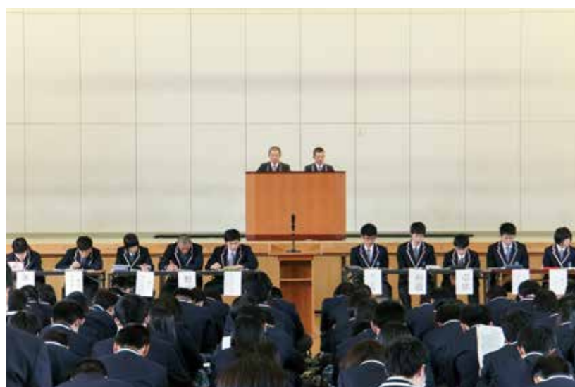
↑緊張感漂う定期生徒総会