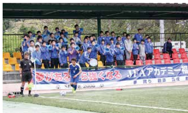
↑目の前の一戦一戦に集中