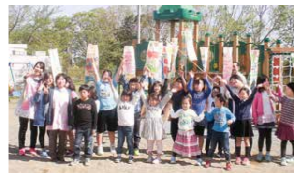
←ウイーンでも元気に泳いでね

5月2日子どもたちが楽しんで作ったこいのぼり。青空の下、元気に泳いでほしいとお外に飾りました。いい笑顔とバンザイに、子どもたちの思いが伝わってきます。こいのぼりは、これからウィーンの空でも泳ぐ予定です。