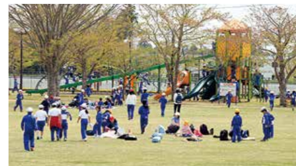
←天気がいいと気持ちいいな！

4月27日、全校生そろって春の遠足で二ツ沼総合公園に行ってきました。伸び伸びと遊んだあとは、おうちの人が作ってくれたお弁当をおいしそうにほおばっていました。仲良く上級生が下級生の面倒をみ、1年生もリタイアすることなく歩き通すことができました。