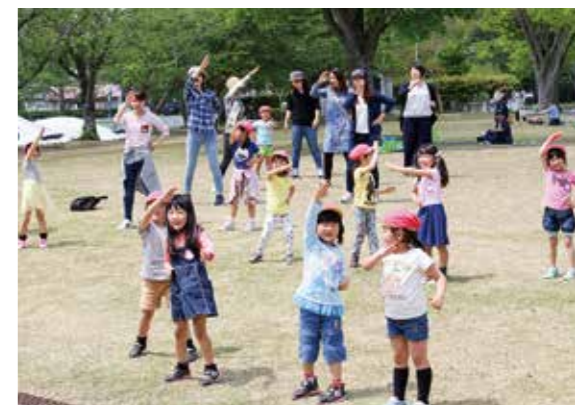
←みんなで元気に体操