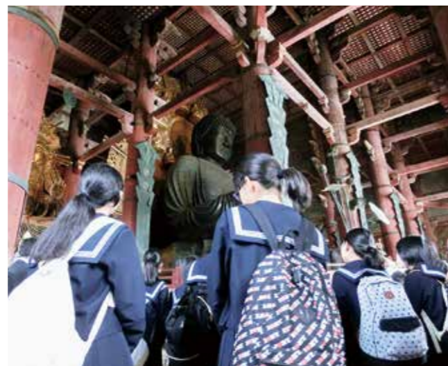
↑奈良の大仏様の大きさにみんなびっくり

4月25日から2泊3日で3年生32人が関西方面へ修学旅行に行ってきました。USJでは楽しい時間を過ごし、京都、奈良では、歴史・文化について貴重な知識・体験を得てきました。日々の学校生活では経験できない有意義な修学旅行になりました。