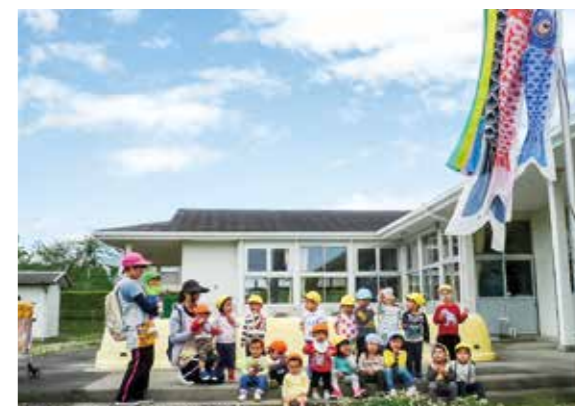
←こいのぼりもみんなの健康を願っているよ