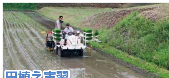
←丁寧に指導してもらった生徒