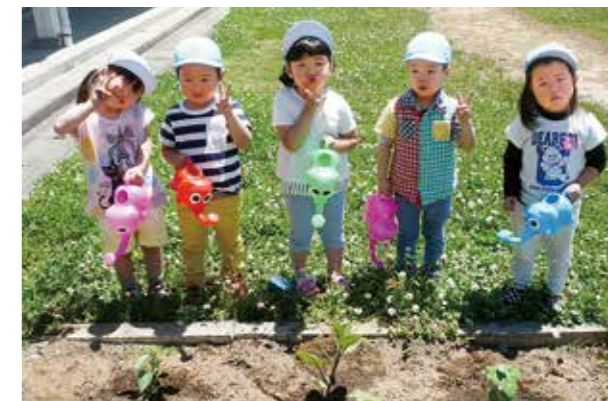
←みんなでハイチーズ!

6月、3歳児ぞう組の子どもたちは、所庭の花壇に、ナス・ピーマン・オクラの野菜苗を植えました。苗を植えたあと、「おおきくなあれ!」と言いながらみんなで水やりをしました。生長を楽しみに、毎日お世話をしているところです。