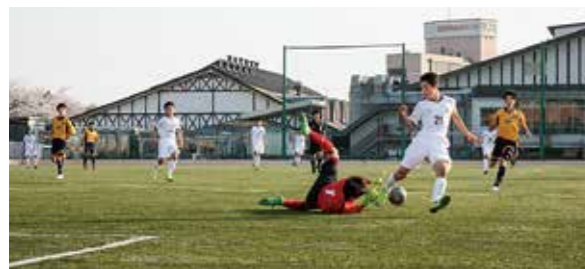
←ピッチ上でベストを尽くす選手たち