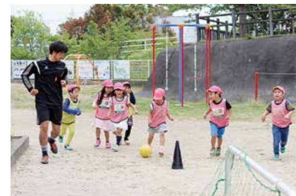
←サッカーの楽しさを実感