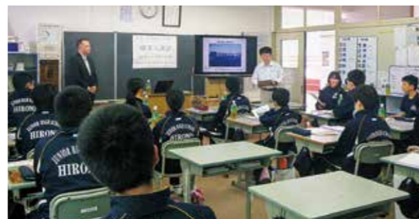
←なるほどなるほど!!

5月17日、キャリア教育に重点を置いた2学年の総合的な学習の時間で、「職業人講話」を実施しました。(株)マルトグループ管理本部の方を講師に招き、商品が店頭へ並ぶまでの流通過程や人とのつながりの大事さ、労働条件の改善などの説明がありました。生徒たちにとって、自分の生き方を考えるいい機会となりました。