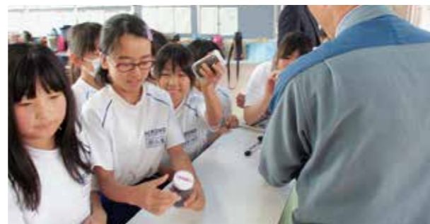
←真剣に話を聞く生徒たち

6月7日、5年生の総合的な学習の時間に広野火力発電所と東京電力発電所の方を招いて環境とエネルギーについて学習しました。国内では、水力発電や火力発電など、いろいろな発電所で電気をつくっていますが、広野火力発電所では、石炭や石油を使って発電していること、また、燃料となる石油や石炭は外国から輸入していることや燃料の特徴を生かすことによって環境に配慮していることを学びました。