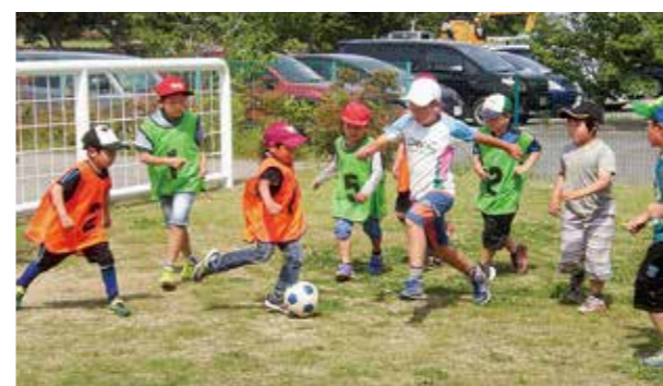
←サッカーに真剣な子どもたち

子供たちも児童館生活に慣れ、元気に遊ぶ姿が見られます。5月のサッカー教室での体験をもとに、6月に入ってもボールを追いかけゲームを楽しんでいます。ハッピーな気分にしてくれるサッカーに子供たちは夢中です。