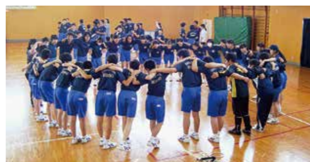
←みんなで一致団結

5月22日、生徒会が企画・運営する春レクが行われました。体育の授業や昼休みに練習を行い、当日はその成果が随所に見られ、大いに盛り上がりました。生徒たちは真剣に競技に取り組み、クラスの勝利に貢献していました。団結力や協力し合う気持ちをこれからの学校生活に生かしていきます。