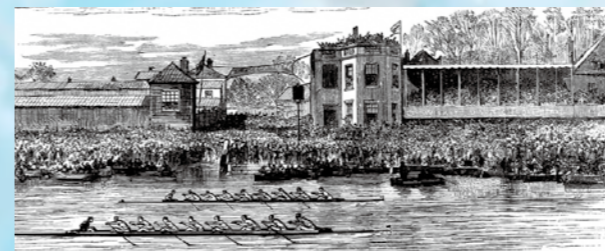
A picture of the 1877 draw 1877年の引き分けの絵