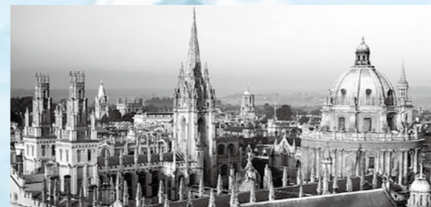
Oxford University, founded around 1096 およそ1096年に設立されたオックスフォード大学

レースの当日には、およそ25万人の観客がテムズ川の両岸に集います。さらに1,500万人以上がテレビで観戦します。日本において、これに最も近いイベントは「箱根駅伝」ではないでしょうか。大学対抗であり、国内で最も多く見られており、そして期待を集めているスポーツイベントである、という点で。