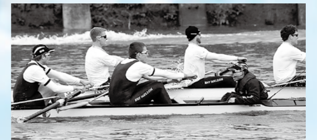
The 2013 races 2013年のレース