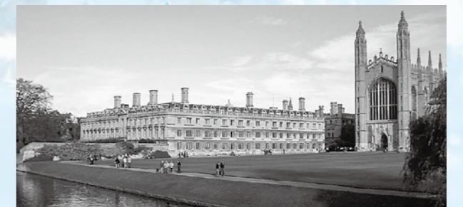
Cambridge University, founded in 1209 1209年に設立されたケンブリッジ大学