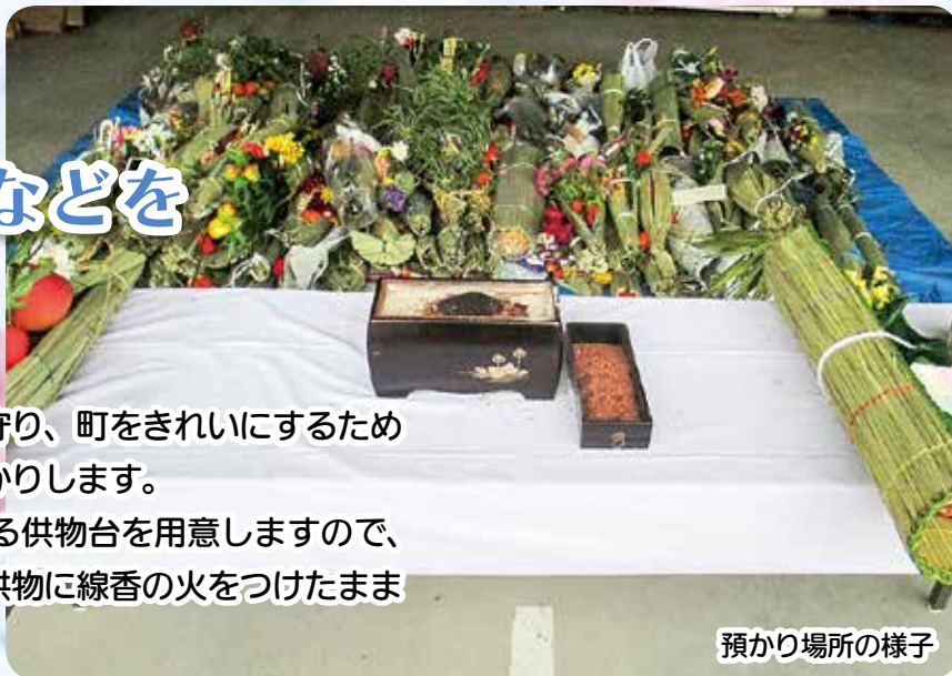
預かり場所の様子

町内の河川と海岸の環境を守り、町をきれいにするために、盆送りの供物などをお預かりします。