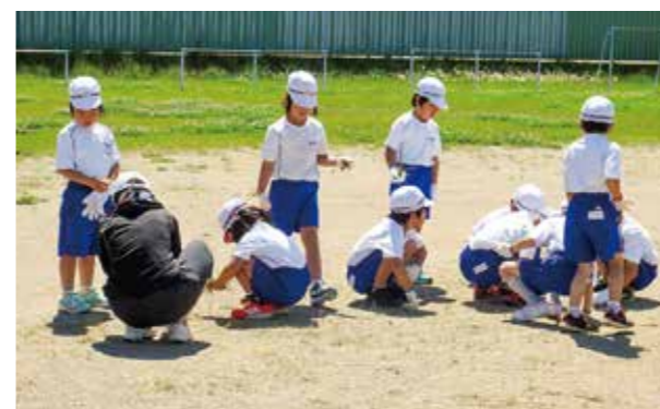
←あっとい間に伸びてくるからな!

6月9日、全校児童でクリーン作戦を実施しました。校庭を学年で分担し、限られた時間の中で一生懸命、草をむしりました。子どもたちができなかった箇所は翌日、保護者によるPTA奉仕作業で除去しました。