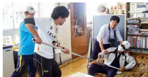
←先生たちも真剣です

6月12日、小中学校合同で防犯教室を実施しました。まず、不審者侵入対応訓練を行い、校内に侵入してきた不審者を教職員が取り押さえるとともに、子どもたちの安全確保に向けた手順を確認しました。その後、体育館で双葉警察署の方より日頃の防犯意識や万が一の場合の避難の仕方について指導していただきました。引き続き、安全・安心のもとで学校生活を送ることができるように取り組んでいきます。