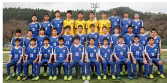
←全国大会に向けて 気合十分