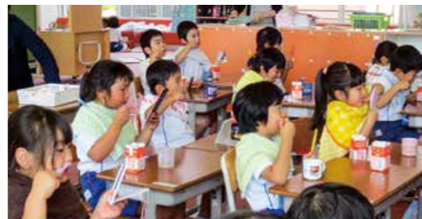
←しっかりと歯を磨こうね

6月20日、1・2年生を対象にむし歯予防教室を実施しました。模型をもとに講師の先生から正しい歯の磨き方や磨く順番の大切さを教わりました。今日の学習を生かし、家でも丁寧に磨き、むし歯ゼロをめざしましょう。