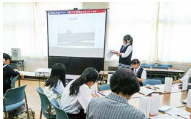
←自分の意見を発表する生徒