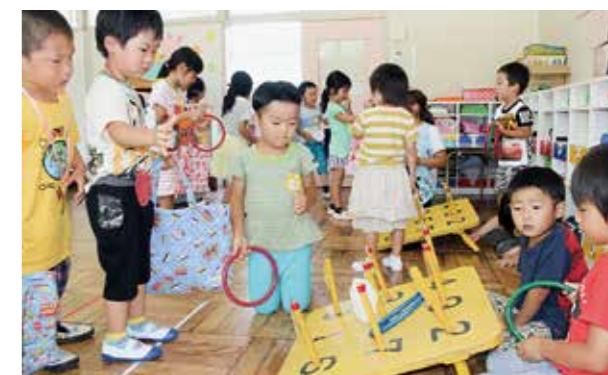
←うまく入らないなく

7月14日夏祭りを開催しました。暑さに負けず、元気なかけ声やゲームをするお友だちを応援する姿が見られました。クラスごとに金魚すくいやわなげ、アイス屋さんなどバラエティに富んだ楽しいお祭りでした♪本当のアイスも食べて大満足の子もたちでした!!