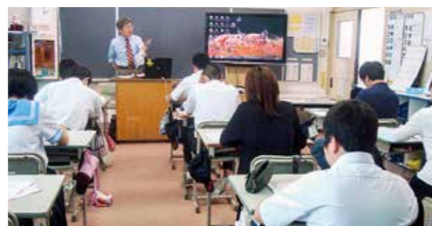
←資料をもとに説明を聞く生徒たち

6月20日、2・3年生と保護者を対象として高校説明会を実施しました。3年生にとっては中体連も一段落し、真剣に進路を考えなければならない時期に入っています。将来の目標を話し合いながら、今回の説明会も参考にして、早めに志望校や志望学科を設定し、有意義な夏を過ごすように声をかけていきます。