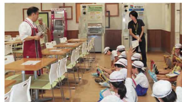
←店長さんに質問する子どもたち

9月15日、3年生が社会科の学習で、ひろのテラスの見学学習に行ってきました。働いている人の人数や「どうして野菜や肉...と順番にならんでいるのですか?」など、店長さんが子どもたちの質問に答えてくださいました。店の裏側も見学させていただき、お客さんに買い物をしてもらうための、様々な工夫や苦勞に気付くことができたようです。