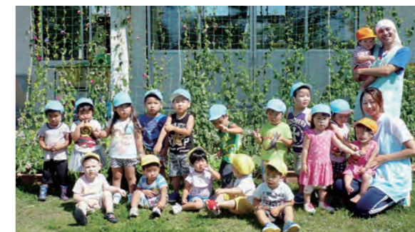
←みどりのカーテンに喜ぶ子どもたち

6月に、みんなで植えたアサガオとゴーヤがぐんぐん伸びて、みどりのカーテンになりました。葉っぱの中のカエルやバッタを見つけると大喜びの子どもたちでした。