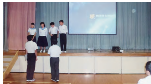
←自作映画の完成を披露する1年生

9月7日、1年生が1学期から総合的な学習の中で取り組んできた「広野映像教育プロジェクト」の上映会を開催しました。広野町の復興、未来、歴史、郷土料理をテーマに生徒たちが町内で取材や調査を行った映像を学生スタッフの方々が編集してくださりました。生徒たちは、自分たちの活動が映画になった喜びを感じ、満足そうな表情を見せていました。