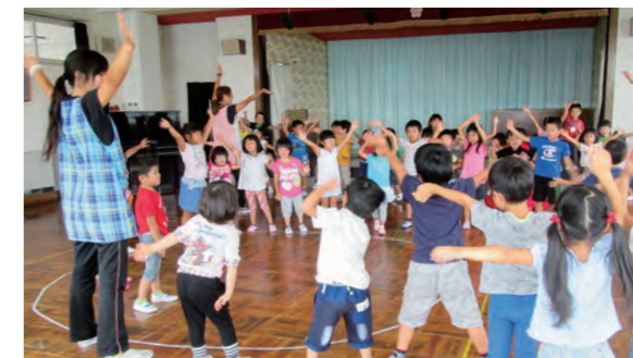
←本番を前に練習にも熱が入ります

9月24日の運動会を楽しみにしながら、3歳児から5歳児までみんな一緒に踊っています。徐々に練習にも力がいってききました。本番が楽しみです。