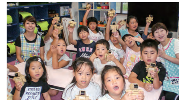
←かっこいいロボットができました

9月5日、低学年(1～3年生)の子どもたちが、ロボット作りチャレンジしました。ダンボールのパーツをボンドでつけて、形になっていく楽しさを味わい、仕上げる「できたー」と歓声があがりみんな大喜びでした。