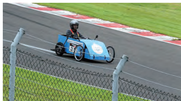
←サーキットコースを疾走する電気自動車