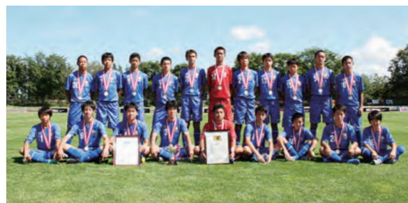
←クラブユース選手権で準優勝したメンバー