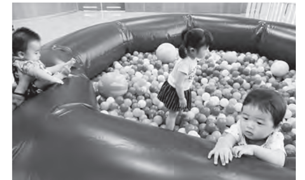
ボールプールで遊ぶ子どもたち

☆内容：お話ししたり、遊んだり自由に過ごしてください。おもちゃや絵本はお貸しします。