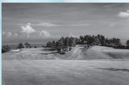
神戸ゴルフ倶楽部のコース