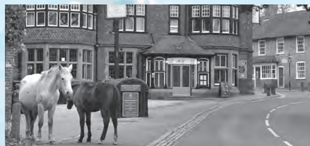
Brockenhurst town ブロークンハースト町

秋のニューフォレストはことさら美しく、私の祖父母がそこに住んでいたこともあり、何度も訪れました。秋めく一年のこの時期になると、家族で森を歩いたことや、開拓地でポニーとばったり出会ったことなどを懐かしく思い出します。