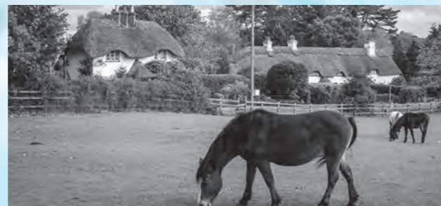
Traditional thatched-roof houses in Swan Green village スワングリーン村の昔ながらの藁葺き屋根の家