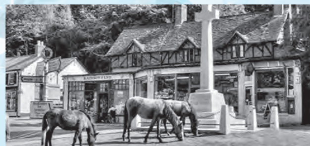
Burley village バーレイ村