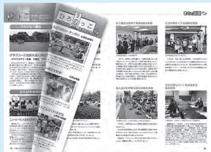
電子書籍の閲覧イメージ

※広野町公式ホームページにバナーを設置していますので、クリックして専用ページにアクセスしてください。