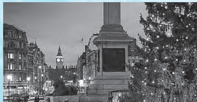
Trafalgar Square is very close to Big Ben トラファルガー広場はビッグベンのすぐ近くです