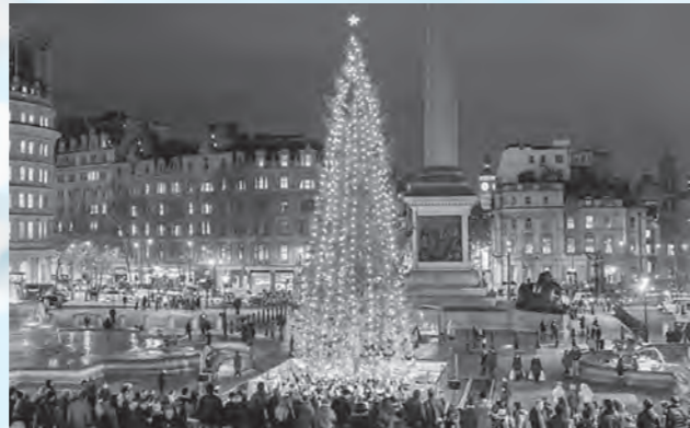
Trafalgar Square トラファルガー広場

木は11月にあるセレモニーで切り倒され、1100km以上離れたロンドンまで船で運ばれ、ノルウェー式のシンプルな垂直のイルミネーションのコードで飾り付けられます。クリスマス期間中、イギリスとノルウェーの友情の証として、また毎日トラファルガー広場を通り過ぎる多くの人々の待ち合わせ場所としての役割を果たしています。