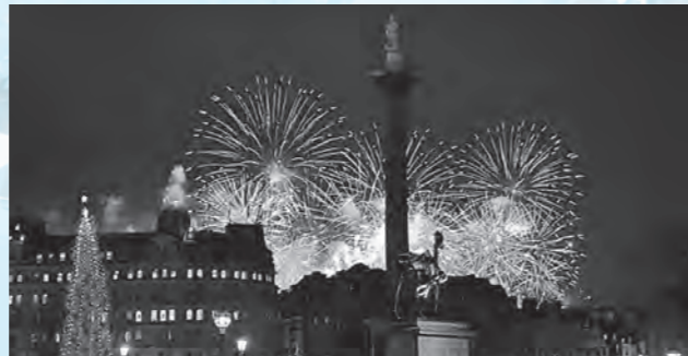
New Year's Eve Fireworks 大晦日の花火