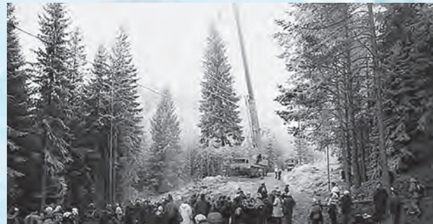
The tree is felled in Norway この木はノルウェーで切り倒されます