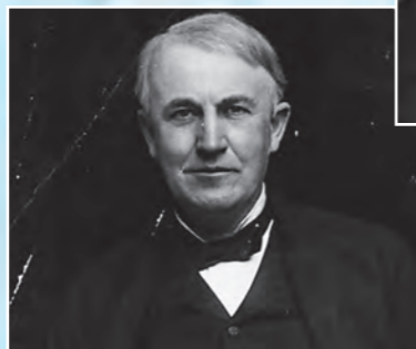
Thomas Edison トーマス・エジソン