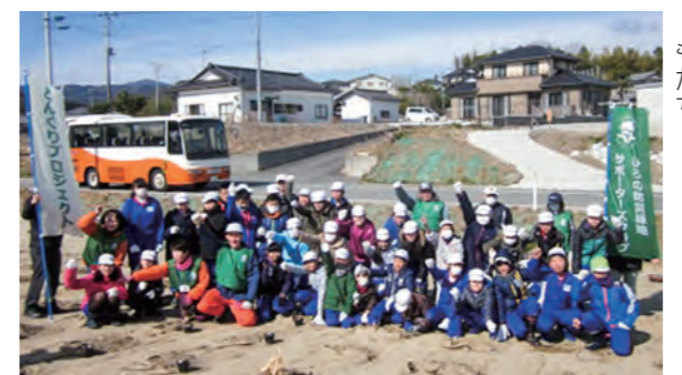
←ドングリの苗を植樹した子どもたち

2月24日(水)、5年生と6年生が、町内浅見川地内のひろの防災緑地でドングリの苗木約200本を植樹しました。平成26年12月に子どもたちがポットに植えたドングリを移植したものです。成木になるには5年から10年かかりますので、子どもたちと一緒に成長していくでしょう。