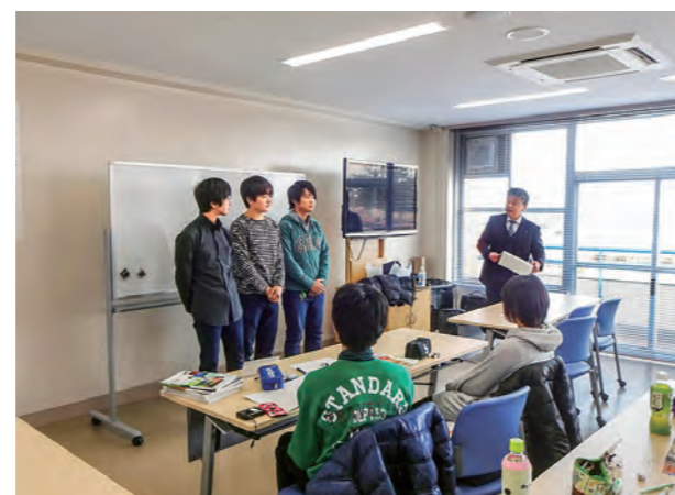
←町営学習塾閉講式の様子

2月28日(日)、広野町中央体育館で平成27年度最後の広野町営学習塾を開催しました。最後に閉講式を行い、平成27年6月から平成28年2月まで毎月土曜日と日曜日、合計19回のスケジュールを終了しました。受講生である広野中学校の生徒は、講師を務めた大学生から激励を受けました。