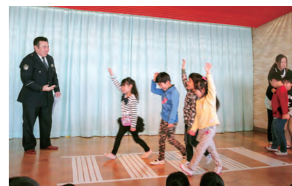
←交通安全教室の様子

2月25日(木)、「交通安全教室」を行いました。町の駐在さんに横断歩道の渡り方や信号機について教えてもらいました。道路で遊ばないこと、飛び出さないことも約束しました。