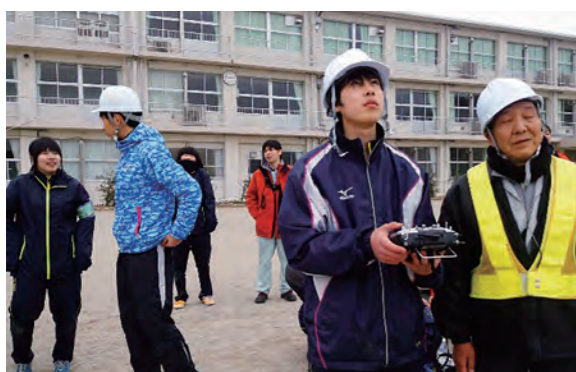
←放射線マップ事業を体験する生徒たち