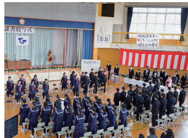
←校歌を斉唱する卒業生たち

3月11日(金)、広野中学校体育館で第69回卒業証書授与式を挙行し、18人の生徒が卒業しました。町で唯一の中学校なので、保護者もほとんどがこの学校の卒業生です。式の最後に校歌を斉唱するときは、卒業生、在校生、教職員、保護者および来賓の全員で歌いました。5年前のこの日に小学校4年生で東日本大震災を体験した卒業生は、立派に成長して学びやを巣立ちました。