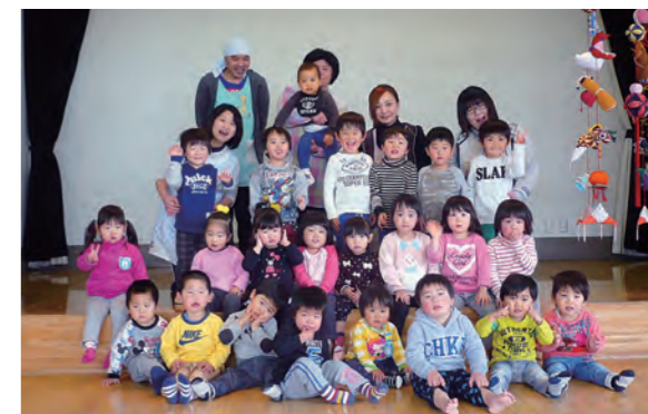
←つるしびなと記念撮影をする子どもたち

3月3日(木)、つるしびなと一緒にニコリ笑顔でひな祭りの記念撮影をしました。さくら組さんも、ひまわり組さんも、たんぼぼ組さんも、1年でみ~んな元気に大きく成長しました。