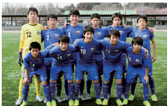
←東海リーグの初戦に勝利した9期生