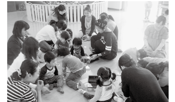
「げんキッズ」で友達づくり

☆内容：お話ししたり、遊んだり自由に過ごしてください。おもちゃや絵本はお貸しします。