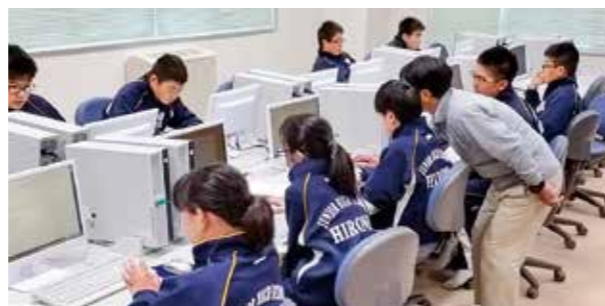
←パソコン操作を学ぶ1年生