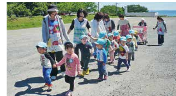
←天気が良くて気分も上々

5月晴れの下、お友だちや先生と手をつないで、保育所周辺をお散歩しました。お花を見たり、虫さんに気がついたりしながらお散歩を楽しんでいました。