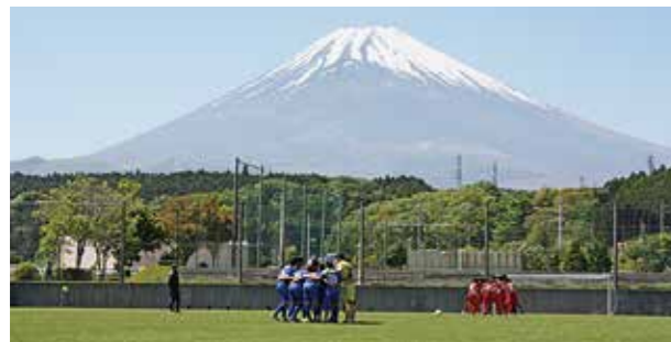
←富士の麓で日々練習