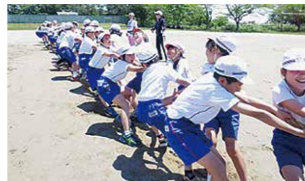
←心ひとつにヨイショ！

運動会の予行を行いました。全体種目の綱引きや鼓笛、各ブロックの団体戦やチャンス走を中心に行いました。5・6年生が係の仕事をしっかり行い、本番さながらの楽しい応援合戦や競技となりました。