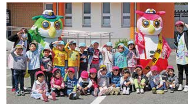
←みんなと一緒に決めポーズ

4月20日に、中央体育館前駐車場で「交通機動隊」の出動式を見学してきました。パトカーをみたり、白バイに乗せてもらったりした子どもたちは大喜びでした。