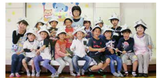
←新聞紙のかぶとで勇ましく変身

5月2日お友達といっぱい遊んで楽しむ1年生。ドキドキ、わくわくの児童館生活がスタートしました。かぶとをかぶって決めポーズ。たくましさややる気を感じられます。今年も、毎日たくさん笑顔を見せてくれますように☆