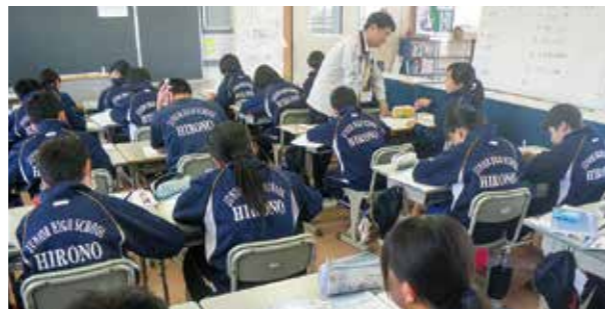
←数学問題を解く子どもたち

広野中学校では、朝の5分と放課後の15分間という隙間の時間を「ひろのタイム」としています。朝は、落ち着いた雰囲気の中で一日の授業に臨めるように、学年裁量で読書や家庭学習の課題点検等に使っています。放課後は、基礎学力の定着を図るためにドリルや受験教材を活用しています。質問してくる生徒が多く、意欲の高さ、熱心が伝わってきます。