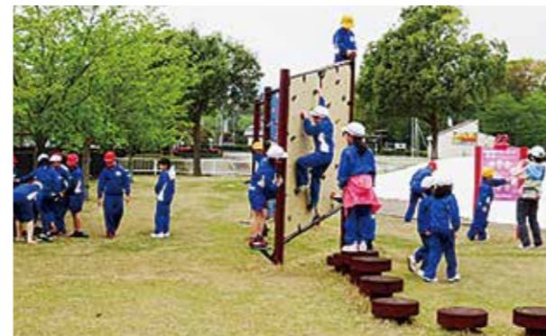
←新しい遊具が大人気

春の遠足で二ツ沼公園に行ってきました。震災後初めての全校生そろっての徒歩遠足でした。5・6年生は途中、北迫地藏尊に立ち寄り、町の学芸員から地藏尊の歴史について話を聞きました。二ツ沼公園では、全校生仲良く遊具などで伸び伸びと遊びました。