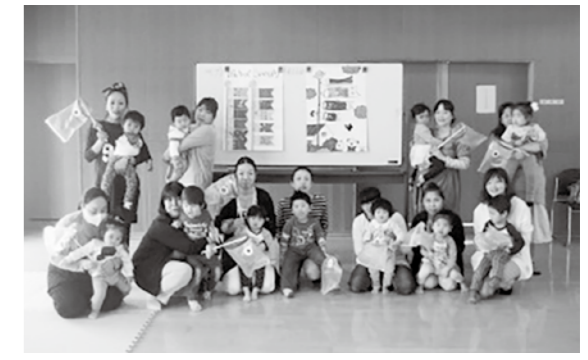
「げんキッズ」こいのぼり作成の様子

毎週、月・水・金の午前中は、親子などの遊びの場として、保健センターの健康増進ホールが利用できます。 申し込みの必要はありませんので、気軽にお越しください。 ☆開放日：月・水・金曜日 (ただし、6/22、24、7/4、6、8は除く) ☆時間：午前9時から正午まで ☆場所：保健センター(健康増進ホール) ☆対象：就学前の乳幼児とその保護者 ☆内容：お話ししたり、遊んだり自由に過ごしてください。おもちゃや絵本はお貸しします。