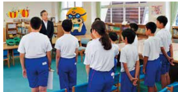
←心豊かな人間を育てるために

6月21日、広野小学校で平成28年度広野町緑の少年団結団式が行われました。この団体は、広野小学校の6年生の児童により組織されるもので、震災後2年目の結団となります。