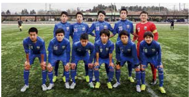
←アカデミー福島のイラスト