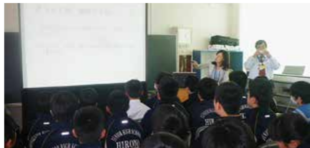
←講演を聴く生徒たち

薬の種類や乱用による体への悪影響について知るために、「薬物乱用防止教室」を開催しました。講師に福島県相双保健福祉事務所の薬剤師を講師に迎え、DVD視聴も踏まえて丁寧にお話いただきました。特に、法律上禁止されている薬や市販されている薬でも乱用すると、「脳」に大変なダメージを与えることになるといった説明がありました。