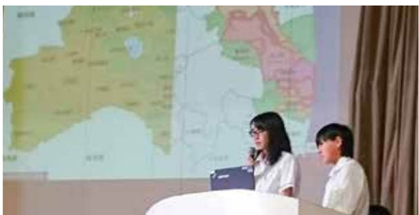
←生徒の発表の様子