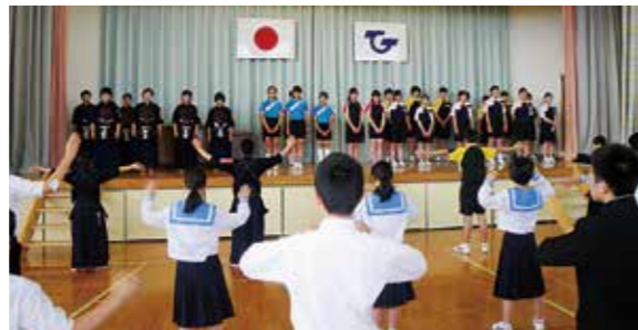
←壮行会で激励を受ける選手たち

地区中体連総合大会を前に壮行会が開かれました。校長先生から、「これまでの努力を精一杯発揮して欲しい。『だめだ』と諦めてしまったらそこまで終わってしまう。技術以上に気持ちを大事にして、ぜひ上の大会に進んで経験を大きくして欲しい。」とのあいさつがありました。