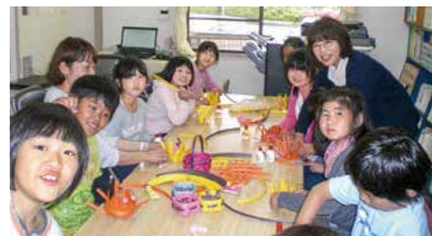
←心をこめて作りました

ボランティアの方々に教わりながら、今人気を集めているクラフトで編み込み、かわいい小物入れが出来ました。「こんなに大切にしてくれてありがとう!」「お仕事ががんばってね。」お母さんへの思いが伝わってくる作品になりました。