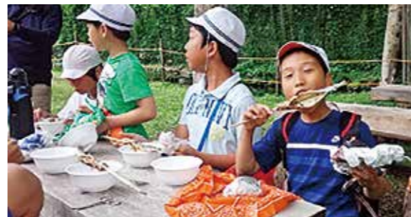
←釣ったイワナを焼く子どもたち

6年生が尾瀬で1泊2日の環境学習を行いました。初日はイワナ釣りに夢中で取り組み、釣った魚を自分たちの手でさばき、焼いて食べました。食べた後は、養殖場の見学や川遊びをしました。2日目は、尾瀬沼周辺を散策しました。天気にも恵まれ、尾瀬のすがすがしい自然を満喫しました。