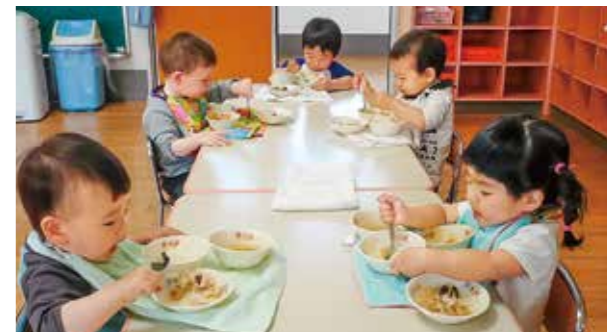
←目は真剣そのものです