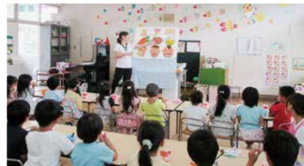
←歯磨きがんばろうね

6月9日に、歯科衛生士さんに前歯や奥歯の役割や食べた後の歯磨きの大切さを教えていただきました。その後、歯ブラシの正しい持ち方や歯磨きについて指導を受け、実際にみんなで歯ブラシを持ってやってみました。