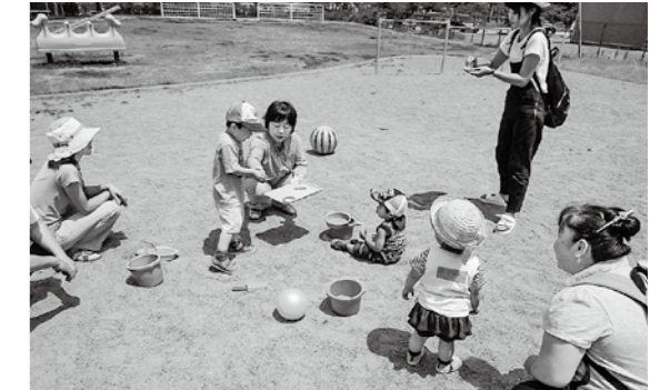
げんキッズ「児童館での外遊び」

☆内容：お話ししたり、遊んだり自由に過ごしてください。おもちゃや絵本はお貸しします。