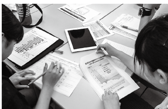
←地方創生イノベーションスクールで議論する生徒たち