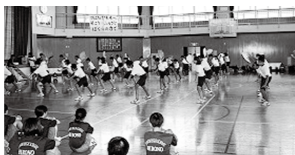
←村上第一中学校との交流会

8月6日(木)、体育館で新潟県村上第一中学校との交流会を行いました。今回、村上第一中学校の皆さんにはチャリティーイベントの義援金やメッセージの入った寄せ書きをいただき、中越地震、中越沖地震の復興を祈念して創られた復興祈念演舞と一緒に踊って、両校の生徒の心が一つになりました。震災直後に始まって4年続いている両校の交流は、今後も続いていくでしょう。