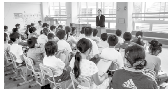
←町長の講話を聞く子どもたち