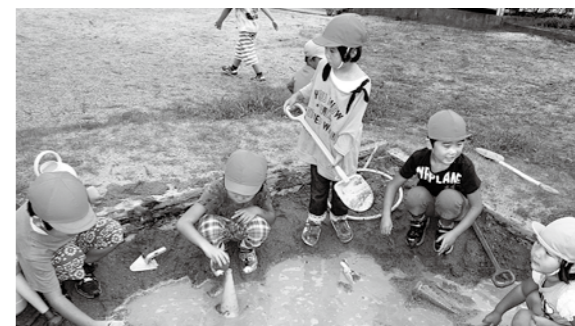
←泥んこ遊びをする子どもたち

8月の終わりから9月の初めにかけて雨の日が続く、砂場に水がたまってトロトロの泥んこができました。それを見つけた子どもたちは、砂場の道具を使って遊び、「泥がはねるよ!」と言いながら楽しんでいました。