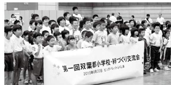
←双葉郡小学校・絆づくり交流会の様子

8月20日(木)、郡山市で第1回双葉郡小学校・絆づくり交流会が開催され、広野小学校の児童も参加しました。初めはお互いに緊張気味の様子でしたが、ゲームや昼食を一緒にして交流し、仲良くなりました。双葉郡の子どもたちは、浜通り、中通り、会津とそれぞれ離れた場所で学校が開かれているのでとても有意義な時間を過ごせました。