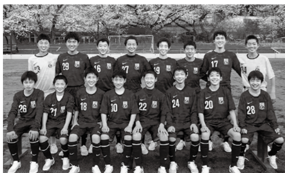
←静岡県2部リーグで勝ち続ける9期生