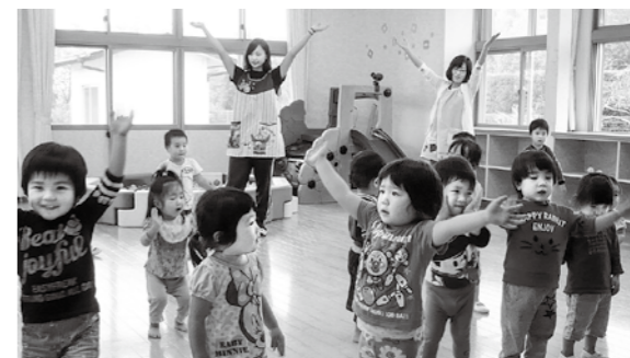
←キビタン体操を練習する子どもたち

9月に入ってからは、10月10日(土)の運動会に向けて、キビタン体操をみんなで練習しています。キビタン体操は子どもたちみんなが知っているの、「おはよう キビタン 青い空〜♪」の歌に合わせて、上手に体操をしています。