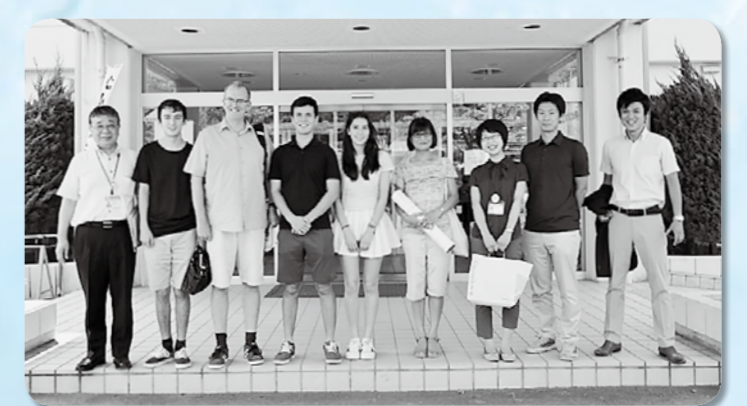
↑役場の前での集合写真