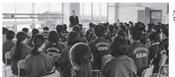
← 町長の講話を聞く生徒たち