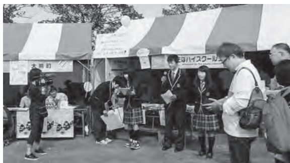
← ふたばハイスクールプラザの様子