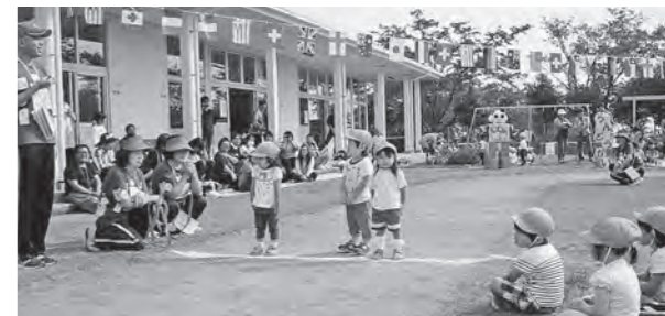
← 保育所運動会の様子

10月10日(土)、広野町保育所の運動会を開催しました。秋晴れの下、子どもたちは元気いっぱい、かけっこやお遊戯、親子競技を楽しんでいました。