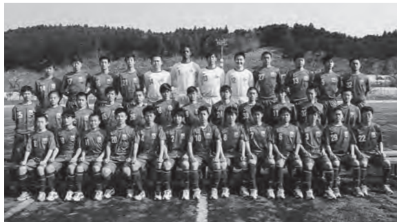
← JFAアカデミー福島チャレンジチームのメンバー