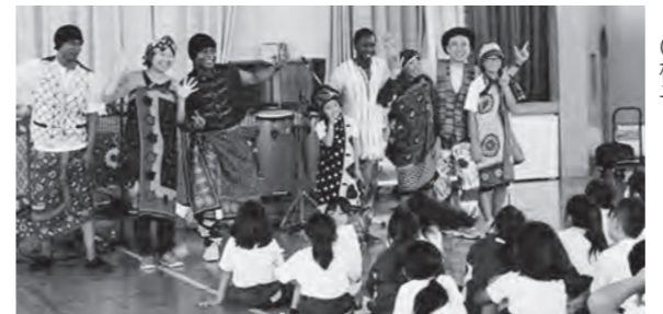
← アフリカンエクスプレスの様子

9月14日(月)日本赤十字社の支援で、タンザニア、セネガルなどの音楽家、舞踊家など4人が来航し、「アフリカンエクスプレス」と題して、太鼓を中心とした演奏を披露しました。子どもたちは、初めて聴くアフリカのダイナミックな演奏を、目を見開いて聴き入っていました。後半は、太鼓のリズムに合わせて、全校生で踊りを教えてもらいながら、みんなで歓声をあげて踊りました。