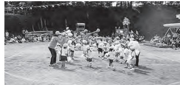
← 幼稚園運動会の様子

9月26日(土)、広野幼稚園の園庭で、平成27年度運動会を開催しました。前日の雨で水たまりがたくさんできていましたが、始まるまでに園庭を整備して間に合わせ、園児たちは元気いっぱいに競技をしました。写真はお遊戯の様子です。