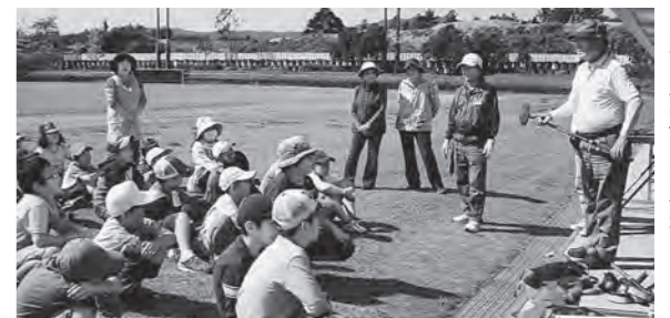
← グラウンド・ゴルフ体験をした子どもたち

10月5日(月)、広野町老人クラブの8人の皆様のご指導により、児童館の子どもたちが広野町総合グラウンドで初めてのグラウンド・ゴルフにチャレンジしました。ルールやクラブの持ち方を教えていただき、コースを回りました。スタートは、緊張気味だった子たちも慣れてくるとパワー全開で、ナイスショットも続出でした。