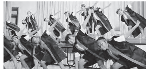
← 学習発表会の様子

10月3日(土)、広野小学校の学習発表会を行いました。前半は、4年生の英語劇「Our Hometown Hirono」、5年生の表現「心ひとつに 2015」、1年生の劇「かえるのおうさま、ひっくりかえる」を披露しました。休憩をはさんで後半は、2年生の表現「元気いっぱいコンサート」、3年生の群読「にじいろのさかなとおくじら」、6年生の表現「力を合わせて」を披露しました。最後に、全校生での合唱「あしたえんそく」「翼をください」を歌い、6年生の閉幕の言葉で締めくくりました。これまで一生懸命練習してきた成果を発表でき、子どもたちの心にも素敵な思い出が刻まれたことでしょう。