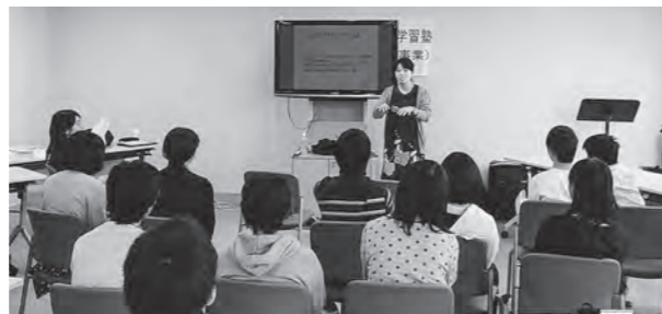
← 大学生による講義の様子

9月26日(土)、27日(日)、広野町中央体育館で今年度4回目の広野町営学習塾を開催しました。この塾は中学生の自習を補助する方式ですが、今回は学習の合間に2人の大学生が講義を行いました。演題は、「3Dプリンターとは何か?」と「アラビア語のあいさつ」についてで、中学生たちはふだん触れる機会のない大学での学習に興味をそそられた様子で、イスラム語であいさつの練習をしながら、「他言語を学ぶことによってその地域の人々の考えを理解する」という考え方を学びました。