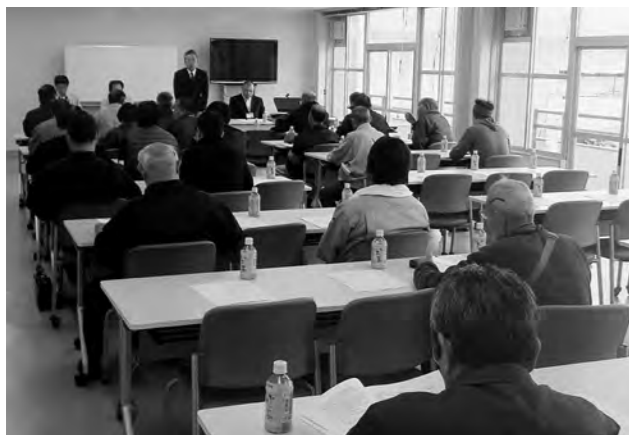
↑道の駅基本構想説明会の様子

10月31日（土）、広野町中央体育館で道の駅基本構想の説明会を開催しました。今回は、候補地の関係地権者向けに開催した説明会ですが、たくさんの出席者がありました。