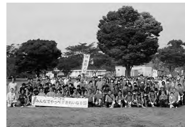
↑国道6号清掃ボランティア広野班の参加者

10月10日（土）、「みんなでやっぺ!!きれいな6国」実行委員会が相双地区の国道6号線沿いで清掃ボランティア活動を実施し、ニッ沼総合公園で開会式が行われました。東日本大震災後休止していたのを再開したもので、大人だけでなく高校生や中学生も大勢参加しました。