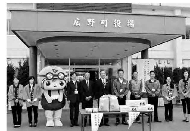
↑ふるさと応援寄附金特産品出発式の様子

10月23日（金）、広野町役場前で平成27年度ふるさと応援寄附金特産品出発式を行い、ふるさと応援寄附金（ふるさと納税）の返礼品の第1便を発送しました。ふるさと応援寄附金30,000円以上の寄附者のうち希望する人に対して、広野産の特別栽培米（コシヒカリ）1俵（60キログラム）と広野産大豆で作った無添加みそ750グラムを贈呈するもので、今年度から始めた取り組みです。