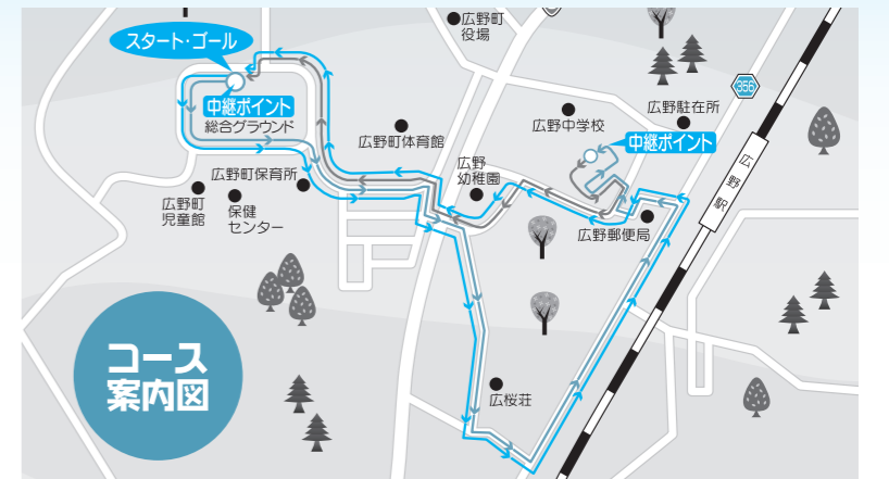
リレーハーフマラソン ●一般の部 ←往路(約1.6km) ←復路(約1.0km) ←1周(約2.6km)