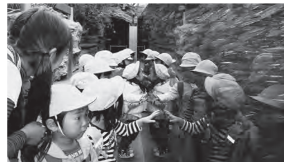
←水族館ではしゃぐ子どもたち

10月22日(木)、広野町幼稚園の園児が、遠足で「アクアマリンふくしま」に行ってきました。魚の群れを見て「魚がいっぱいだ〜」と歓声をあげて水槽に顔を近づけ、水槽越しに手で触れようとする子どもたちの様子です。