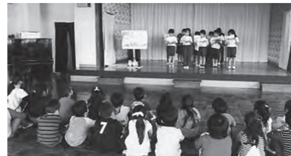
←広野幼稚園を訪問した1年生

11月10日(火)、広野小学校の1年生が、広野幼稚園を訪問しました。国語の時間に学習した「くじらぐも」の朗読をして、折り紙で作ったプレゼントを園児に渡しました。この3月まで広野幼稚園に通っていた1年生も何人かいて、懐かしそうにしていました。