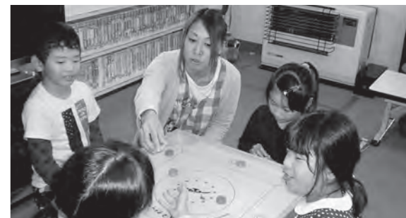
←カロムで楽しむ子どもたち

カロムは、ビリヤードとおはじきを合わせたゲームで誰とでも対戦できる遊びです。広野町児童館では、子どもも職員も今大会に向けて頑張っています。同じ局面が二度とない面白さに、11月は熱い戦いが見られそうです。