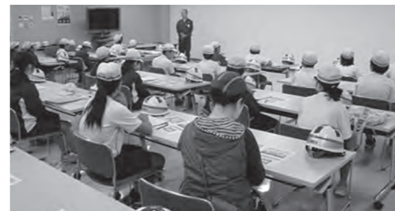
←火力発電所を見学する子どもたち

10月30日(金)、広野町小学校の5年生が、総合的な学習の時間の一環として、広野火力発電所を見学しました。子どもたちは、この発電所の総出力が440万キロワットで、一般家庭約146万軒分の消費電力に当たることにびっくりしていましたが、環境保全のために、排水や排煙処理のための施設も工夫されていることにも感心したようです。