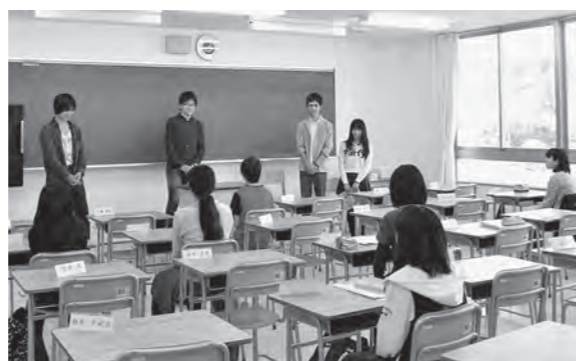
←ふたば未来学園高校で行った町営学習塾

10月24日(土)、25日(日)、ふたば未来学園高校の実習棟で広野町営学習塾を行いました。広野中学校の生徒は、平成26年度の1学期まで通った学校で勉強することができ、とても懐かしそうでした。