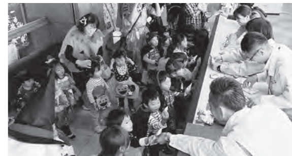
←ハロウィーンの仮装をした子どもたち

10月30日(金)、広野町保育所の児童と保育士が、ハロウィーンの仮装をして、公民館から役場まで出かけてきました。お菓子をたくさんもらって、大喜びの子どもたちでした。