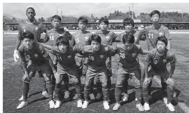
←プレミアリーグを戦うイレブン